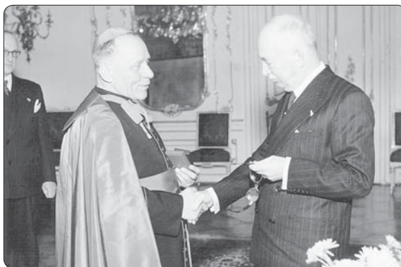
Msgr. Josef Beran s prezidentem ČSR Edvardem Benešem

Začínala další etapa boje proti církvi, boje krutého a zákeřného, jenž podle plánu Božích nepřátel měl být završen zánikem náboženství. Zůstaly by jen modly Marxe a Lenina. K této katastrofě našťastí nedošlo. Brány pekelné Ji ani tentokrát nepřemohly!