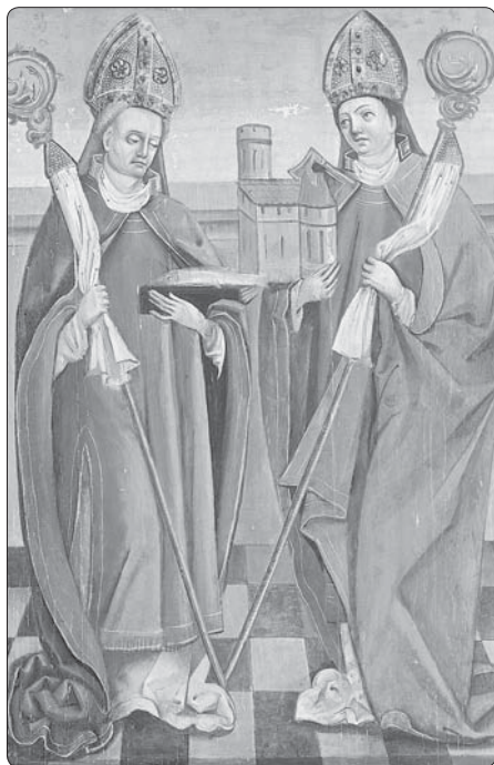
Sv. Oldřich a sv. Wolfgang (kolem roku 1510)

bylo trudno neveselo. Země úpěla pod nájezdy loupeživých Uhrů, kteří plenili a louplili v městech a vesnicích široko daleko. Tehdejší biskupové byli chápáni jako církevní knížata a k jejich povinnostem patřil častý pobyt u panovnického dvora či osobní účast na poli válečném. Oldřich si u Jindřicha vymohl dispens, aby mohl zůstat se svými ovečkami a u dvora aby ho nahradil jeho synovec Vojtěch. Ač nerad, císař svolil, a tak mohl Oldřich chodit plakat s plačícími a rozdat své jmění prakticky do posledního feniku potřebným. Prozíravě zesílil opevnění Augsburgu a znovu vystavěl pobožené svatyně v diecézi, zřizoval školy, zakládal kláštery, založil i hospic. Pobízel svůj klérus k opravdové zbožnosti oproštěné od stereotypu a vlažnosti, věřící pak k životu hodnému nositelů jména Spasitelova. Lid přijal jeho výzvy k větší zbožnosti a mravnosti, neboť denně byl k vidění dlouhé hodiny před svatostánkem, k slyšení v chrámovém chóru, věřící si šeptali