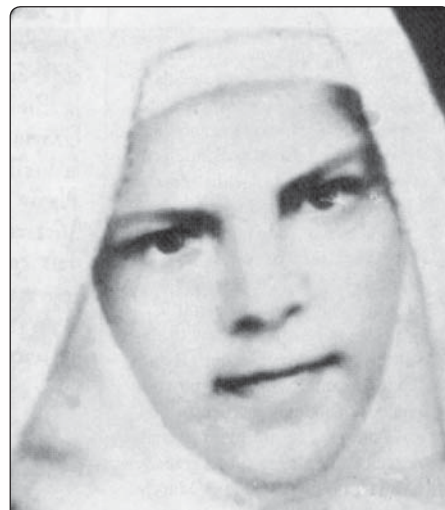
Blahoslavená Maria od Ukřižovaného Ježíše

Když se na těle sestry Marie objevova- ly rány Kristových muk, přenášeli ji do la-