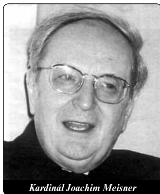
Kardinál Joachim Meisner

nezaložil svou školu, nýbrž své následování. Není Bohem filozofů, nýbrž Bohem Abraháma, Izáka a Jakuba. Proto nepotřebuje funkcionáře, ale učedníky. Nechce mít náboženské úředníky, nýbrž mučedníky. Nechce ti-