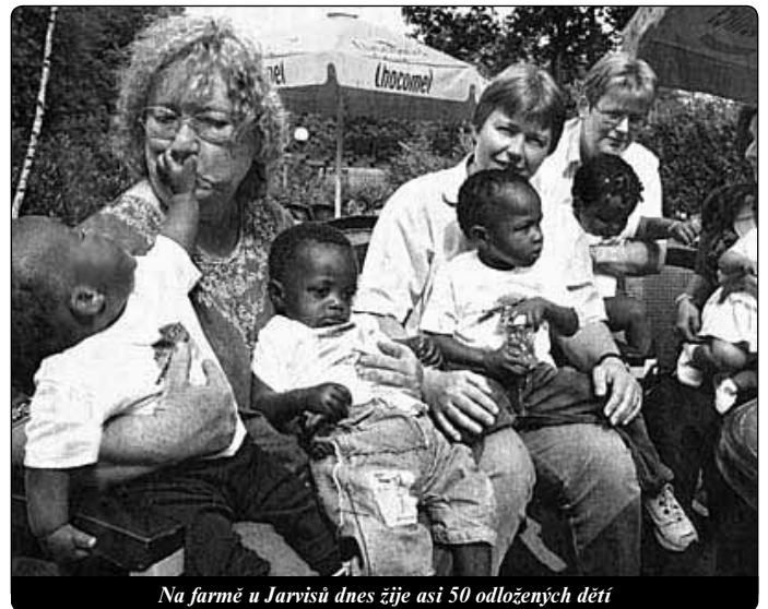
Na farmě u Jarvisů dnes žije asi 50 odložených dětí