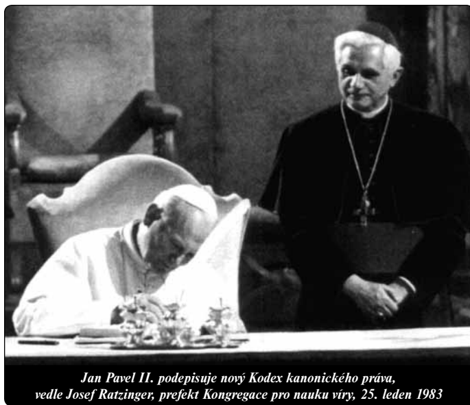
Jan Pavel II. podepisuje nový Kodex kanonického práva, vedle Josef Ratzinger, prefekt Kongregace pro nauku víry, 25. leden 1983

Před více než deseti lety stál před podobným dilematem jiný kněz, ponořený do vědy na univerzitní katedře. I když současně prováděl rozsáhlou pastorační činnost, netušil, že Prozřetelnost radikálně změní jeho životní dráhu. Ovšem okolnosti, jak se dva budoucí papežové dověděli o svém jmenování biskupem, byly odlišné. Když Karola Wojtylu informoval kardinál Wyszyński o jeho biskupské nominaci, ihned řekl: „Přijímám.“ Papežský nuncius, který navštívil Ratzingera v Řezně koncem března 1977, měl s sebou jmenovací listinu na arcibiskupa Mnichova a Freisingu, ale odevzdal ji jmenovanému až na konci rozhovoru s tím, aby si odpověď rozmyslel a poradil se se zpovědníkem.