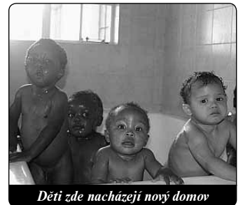
Děti zde nacházejí nový domov

Z „psiho dítěte“ je dnes vážný mladík, který velice miluje hudbu a nade všechno má rád gospel. Chodí do školy, ale pokroky dělá jen velice pomalu, protože jeho zrak byl nemocí AIDS značně poškozen. „Mnoho našich dětí má AIDS,“ vypravuje Pippa, „což je také často důvod,