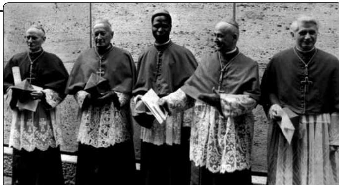
Kardinál Ratzinger ve společnosti kardinálů (zleva): Giovanni Benellego, František Tomášek, Bernardín Gantin, Giuseppe Caprio

Biskupské svěcení se konalo 28. května 1977 o svatodušní vigilii. O měsíc později 27. června ho Pavel VI. jmenoval kardinálem. Jako mnichovský arcibiskup byl již od progresistů označován za konzervativce a rozhodného přívržence doktrinální tradice, odpůrce liberalismu, podobně jako krakovský metropolita Wojtyła. To jistě vedlo ke konfliktům s dřívějšími kolegy, i když mu přes jeho konzervatismus přiznávali největší schopnost pro dialog. V knížce „Sůl země“ popisuje toto období: „Ješ-