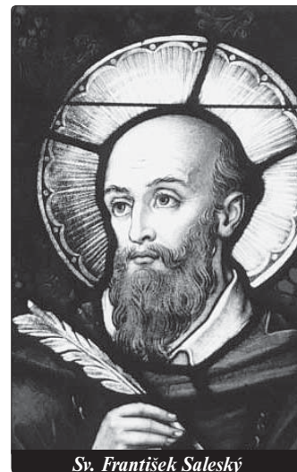
Sv. František Saleský