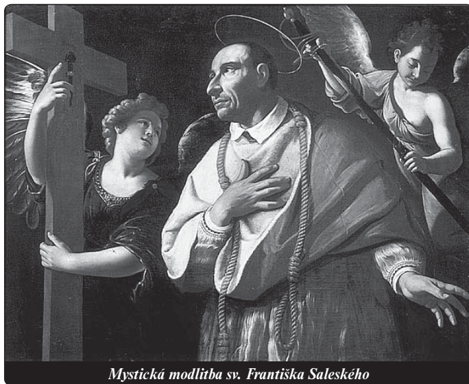
Mystická modlitba sv. Františka Saleského

Nejednou ho na cestě překvapila noc. Jednoho večera