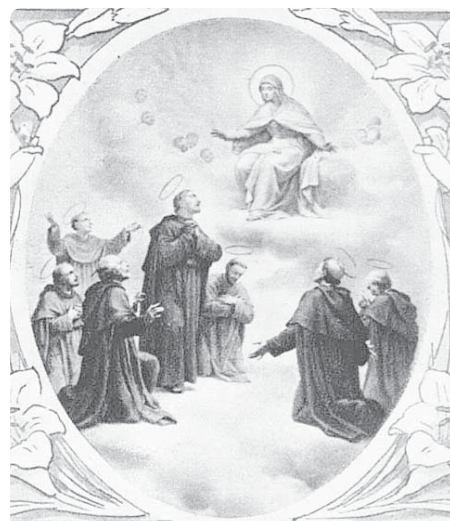
Sv. Alexius a druhové

Avšak již brzy se o nich mluvilo po celém okolí, takže museli čelit návalu zájemců o vstup do svých řad. Jestliže první křesťané žili tak, že nevěřící okolí slovy „ hle, jak se milují “ žaslo nad jejich vzájemnou láskou, tak pro první servity to platilo beze zbytku též. Počet těch, kdo toužili podle jejich vzoru dát vale světu, rostl, takže nakonec byli v květnu roku 1234 nuceni opustit domek, který až dosud obývali, a s vidinou dosažení většího klidu přesídlili na úpatí strmé hory