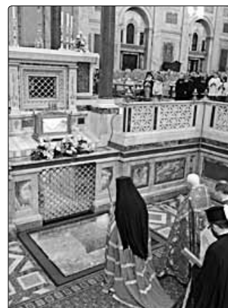
V sobotu 28. června v římské bazilice Sv. Pavla za hradbami papež Benedikt XVI. zahájil Rok sv. Pavla slavením prvních nešpor ze slavností apoštolů Petra a Pavla. Liturgie se vedle mnoha významných hostů účastnil i ekumenický patriarcha Bartoloměj I.

Život a myšlení svatého Maxima mocně ozařuje nesmírná odvaha k integrálnímu svědectví Kristovy skutečnosti, a to bez jakýchkoliv omezení a kompromisů. A tak nám ukazuje, čím člověk skutečně je, jak máme žít, abychom tak odpovídali na své povolání. Máme žít spojení s Bohem, abychom tak byli spojení se sebou a s kosmem a dávali tak kosmu a lidství správnou formu. Univerzální Kristovo „ano“ nám ukazuje jasně, jak dát správné umístění všem ostatním hodnotám. Myslíme na hodnoty, které dnes oprávněně bráníme, jako tolerance, svoboda, dialog. Ale tolerance, která už nedokáže rozlišovat mezi dobrem a zlem, by se stala chaotická a sebedestruktivní. Stejně tak svoboda, která by nerespektovala svobodu druhých, nemohla by najít obecnou míru našich vlastních svobod, sta-