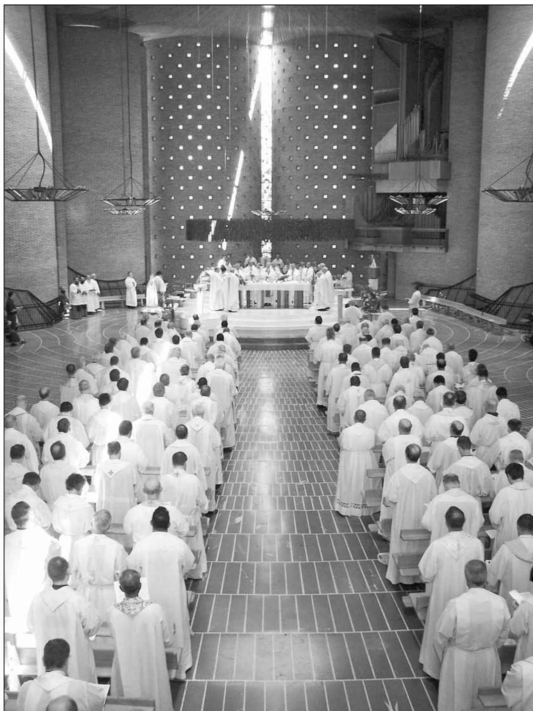
Exercicie Mariánského kněžského hnutí v Colvalezza v roce 2008

Eucharistický život podle příkladu svatých (8) - strana 11 -