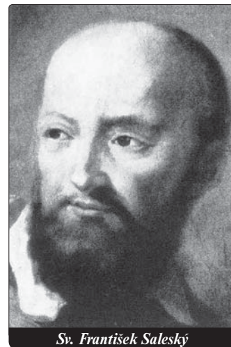
Sv. František Saleský

Všichni přátelé ho ujistili, že taková obrana katolické víry bude užitečná. Obrátil se proto k Bohu pro světlo a modlil se o ně vroucně během mše svaté. Dostal vnuknutí a 7. ledna 1595 se dal do práce. Neměl v úmyslu napsat celé dílo