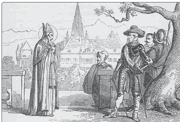
Misie sv. Františka Saleského, dobová kresba

Dílo má tři části. V první je řeč o pravomoci a poslání. Autor dokazuje, že zakladatelé reformace a jejich pokračovatelé se samovolně vetřeli na kněžský úřad, jsou to tedy falešní pastýři a jejich církev je falešnou církví, a proto nemůže zajistit ospravedlnění těm, kteří naslouchají jejich učení. Demaskuje jejich útoky a vytáčky, kterými útočí na pravdu katolické církve. Přesvědčivě poráží jejich bludy o tom, že získali mimořádné poslání, a vyvrací jejich tvrzení o úpadku katolické církve. Pak přechází k rysům pravé církve a dokazuje, že římská církev se vyznačuje jednotou víry, svatostí , která se projevuje v dívech a proroctvích, a univerzálností , neboť se šíří na všechny časy, všechna místa a osoby, je plodná a apoštolská .