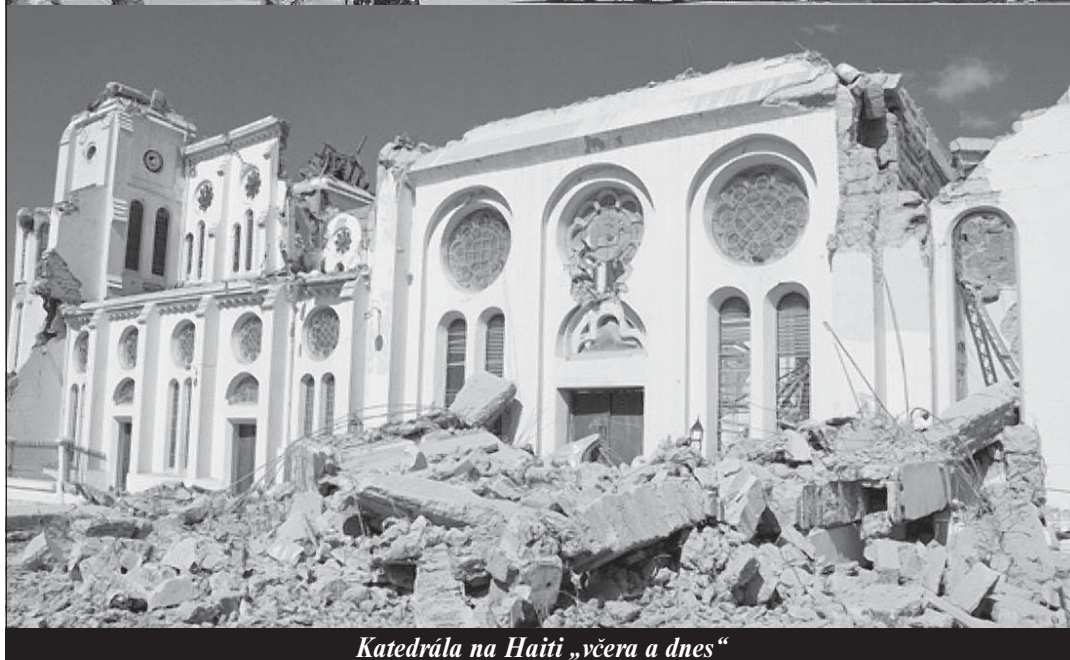
Katedrála na Haiti „včera a dnes“