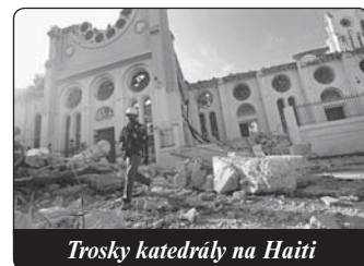
Trosky katedrály na Haiti

Jestliže svou pomoc pošlete převodem ze svého účtu, podejte o tom zprávu na adresu dary@sdb.cz .)