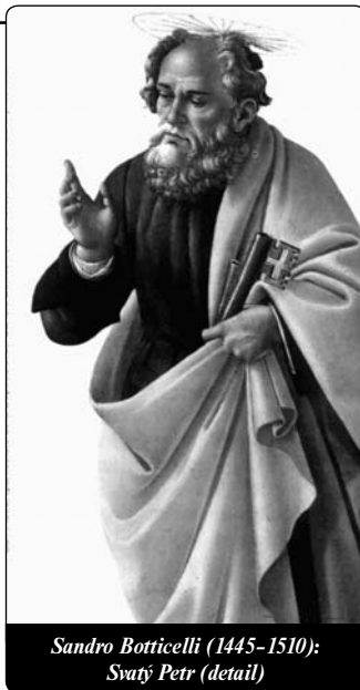
Sandro Botticelli (1445-1510): Svatý Petr (detail)

Zatímco Petr byl z vidění celý na rozpacích, řekl mu Duch: „Jsou tu tři muži a hledají tě. Ihned sestup dolů a bez váhání jdi s nimi, protože já jsem je poslal.“ To je pro Petra pravé světlo. Chápe, že tu působí Duch, a setkání s Kornéliovými posly mu dává poznat, že Bůh ho volá k velké kulturní změně. Bůh