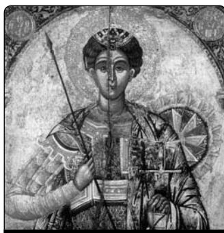
Nicola Onufri: Setník Kornélius , 16. stol.

Je obtížné opustit tradici, která je hluboce zakořeněna. A hlas k němu opět promluvil: Co Bůh