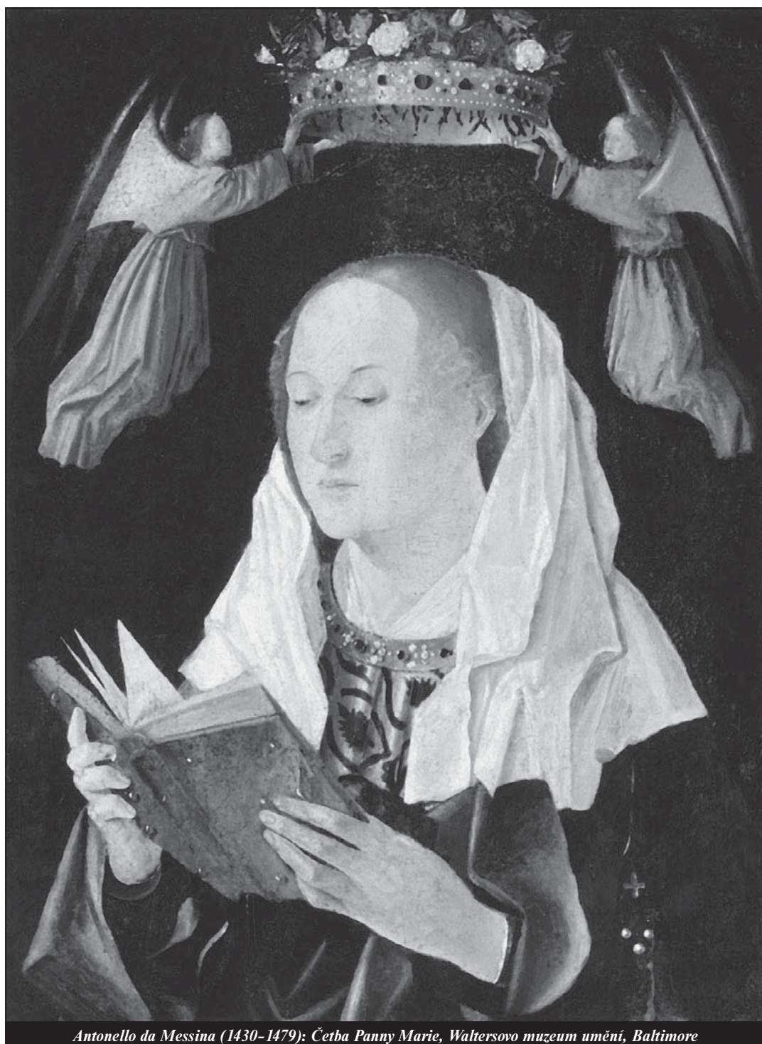
Antonello da Messina (1430-1479): Četba Panny Marie, Waltersovo muzeum umění, Baltimore