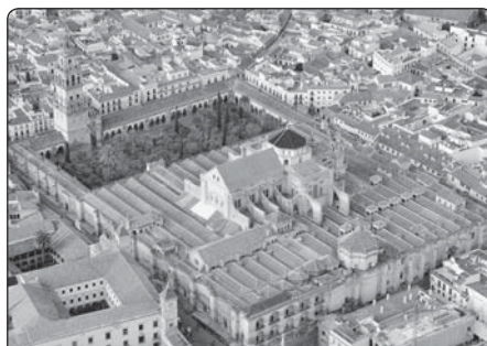
Katedrála v Córdobě. V roce 784 byla katedrála sv. Vincenta odsvěcena a přestavěna na mešitu a v následujících desetiletích rozšířena na 23 000 m 2 . V roce 1236 se stala budova zase kostelem. V roce 1532 byla do komplexu vestavěna gotická katedrála

Zde hraje velkou roli také španělsko-anglický antagonismus v politice. Naopak to působilo ale kladně na obraz muslimského Španělska, jehož obyvatelé byli považováni za oběť španělského násilí a fanatického katolicismu. Vzpomeňme jen na Goethova „Egmonta“ a Schillerova „Do-