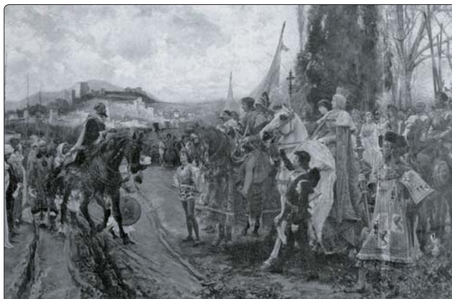
2. ledna 1492 předal poslední emír z Granady město „kato-lickým králům“ Ferdinandovi a Isabele. Malba Francisco Pradilla y Ortiz (1882)

„Sága“ o židovské rovnoprávnosti a mezináboženské harmonii v Al-Andalus na základě islámské tolerance zůsta-