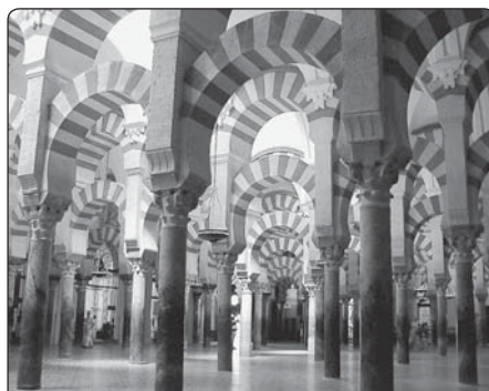
Světověznámá je působivá hala v katedrál-ním komplexu s podkovovitými oblouky, spočívajícími na 856 sloupech, které byly vzaty z chrámů římské doby

la nezpochybněna až do doby před několika desetiletími. Od založení státu Izrael a potom následujících konfliktů hrozilo, že se tato zkazka obrátí proti izraelským Židům, zatímco v Evropě 19. století byla velmi užitečná k podpoře židovského zrovnoprávnění. Z arabské strany byl tento mýtus nejprve používán, jak už bylo řečeno, jako důkaz arabské civilizační převahy, potom ale také nasazen proti sionismu a Izraeli: Tak prohlásil šéf Fatahu Jásir Arafat v roce 1974 před shromážděním Spojených národů: „Arabové (Palestinci)... rozšířili tisíciletou kulturu v celé zemi, představující příklad pro praktikování náboženské snášenlivosti a svobody vyznání a chránili jako věrní strážci svatá místa všech náboženství... Náš národ pokračoval v této osvícené politice dále až do zřízení státu Izrael a jeho rozšíření.“ (cit. podle S. Kohlhammera, str. 107) Bylo by tedy zapotřebí jenom vzdát se sionismu a státu Izraele, aby byla nastolena dřívější