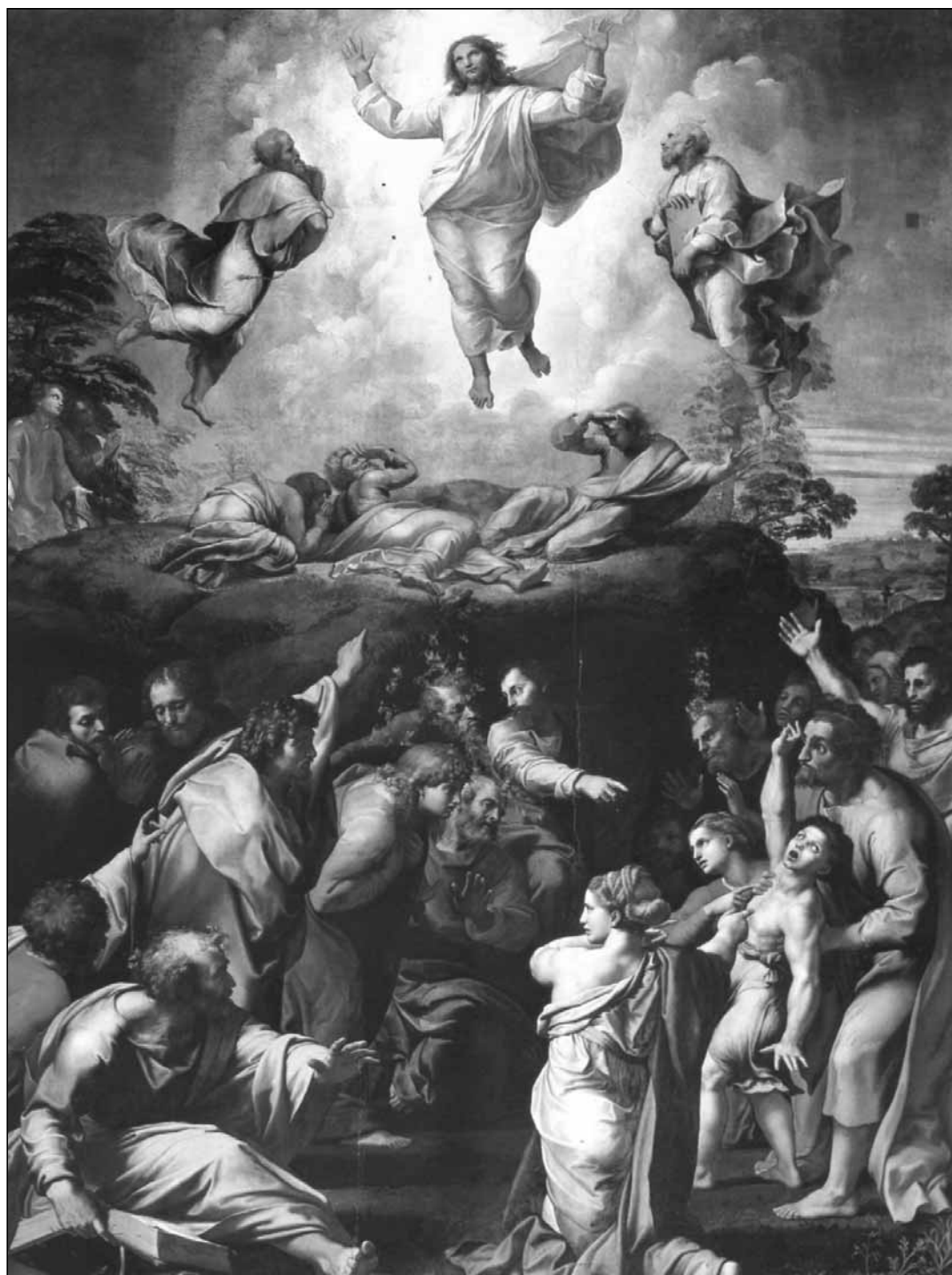
Rafael Santi (1483-1520): Proměnění na hoře Tábor (r. 1519/1520), Řím, Vatikánská muzea