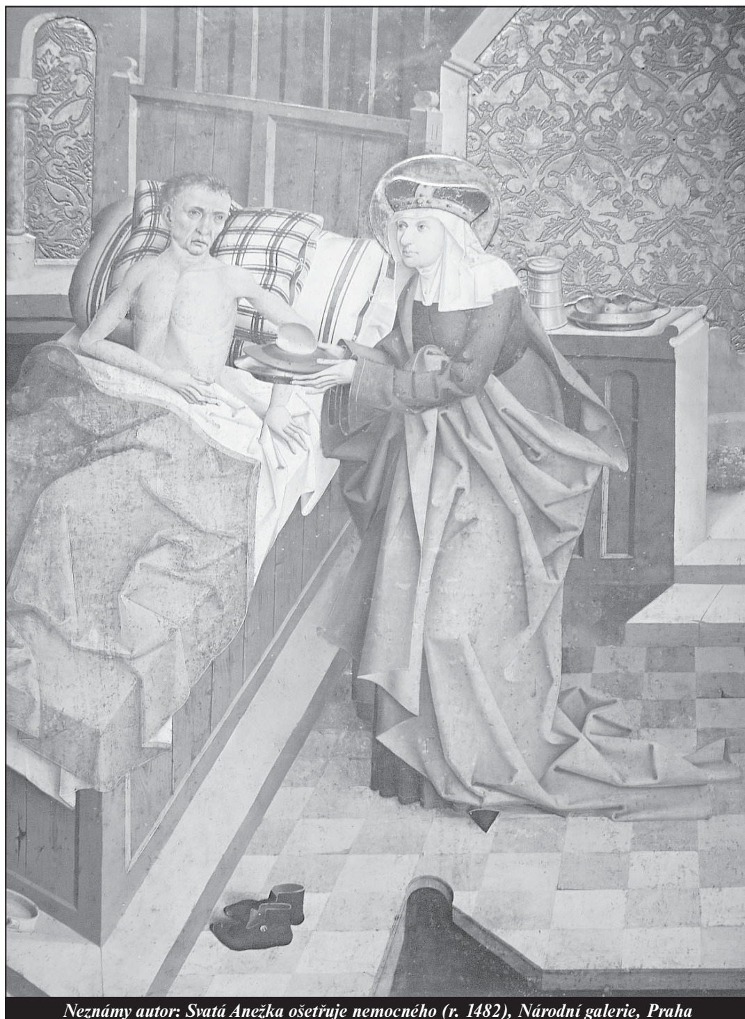
Neznámý autor: Svatá Anežka ošetřuje nemocného (r. 1482), Národní galerie, Praha

Statistika světové katolické církve za rok 2017 - strana 13 -