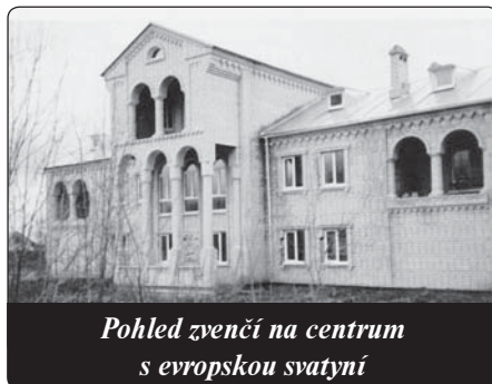
Pohled zvenčí na centrum s evropskou svatyní

Při cestě ke kapli „Maria - Matka Evropy“ jsme na konci tohoto poutního týdne prožili zvláštní vyvrcholení naší cesty. Areál se rozkládá několik kilometrů za městem Berezniki uprostřed přírody. Hlavní budova je podlouhlá, vznešeně působící, dvouposchodová s reprezentativní fasádou, středním traktem se štítem, jakož i s okrasnými vlisy podél celé stavby. Už teď se dá tušit, jak krásný areál to jednou bude. Ještě chybí vnější zařízení. Dosud nejsou vnitřní omítky ani schodiště. Dřevěné fošny pobité latěmi, zábradlí z prken jako ochrana, toto vše slouží návštěvníkovi, aby se dostal do horního poschodí. A potom překvapení: Na konci dlouhé horní chodby je už hotová velká domácí kaple „Marie - Matky Evropy“! Stěny jsou bíle omítnuty, zadní průčelí je