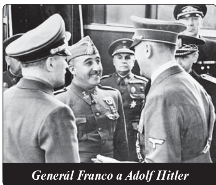
Generál Franco a Adolf Hitler