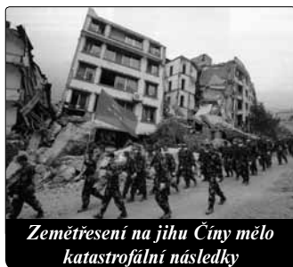
Zemětřesení na jihu Číny mělo katastrofální následky

Je samozřejmé, že odpovědná místa katolické církve v Číně ani papež nemohou vyzývat k modlitbám za odstranění komunismu v Číně. Úloha nejvyššího pastýře spočívá v tom, léčit rány z rozdělení církve v Číně a integrovat ji do světové církve. Proto v oficiálních vyjádřeních záleží papeži na tom, ukázat čín-