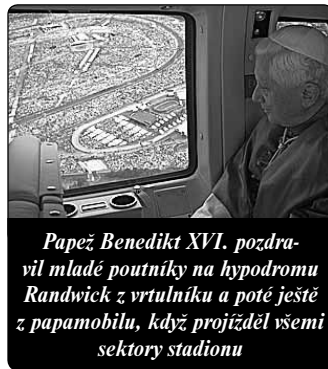
Papež Benedikt XVI. pozdravil mladé poutníky na hypodromu Randwick z vrtníku a poté ještě z papamobilu, když projížděl všemi sektory stadionu

Tato spoluúcast na samotné Boží přirozenosti (srov. 2 Petr 1,4) se uskutečňuje v průběhu každodenních životních událostí, ve kterých On je vždy přítomen (srov. Bar 3,38). Jsou ovšem okamžiky, kdy můžeme být v pokušení hledat určité uspokojení mimo Boha. I Ježíš se zeptal Dvanácti: „Chcete snad i vy odejít?“ (Jan 6,67) Takové vzdalování bohužel nabízí iluzi svobody. Ale kam nás