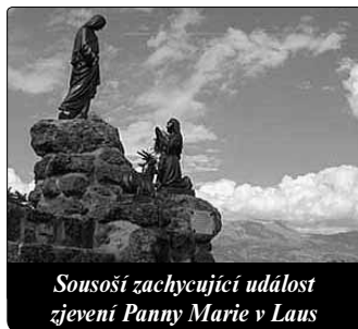
Sousoší zachycující událost zjevení Panny Marie v Laus

S obdivuhodnou vytrvalostí zůstala někdejší pastýřka Benoîte Rencurelová věrna svému poslání.