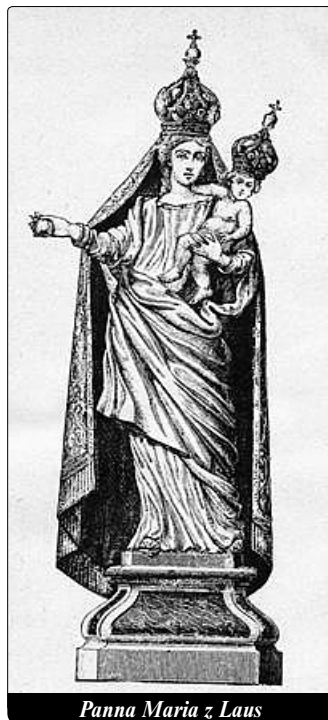
Panna Maria z Laus

V létě 1664 jí bylo právě 17 let, když narazila na jeskyni; tehdy ji obklopilo zvláštní světlo a před sebou spatřila krásnou Paní, která se na ni usmívala. Až do srpna se jí zjevovala denně a hovořila s ní. Když se jí děvče zeptalo, zda je Panna Maria, odpovíděla: „Ano, jsem Maria, Ježíšova Matka. Můj Syn si přeje, abych toto údolí zvláštním způ-