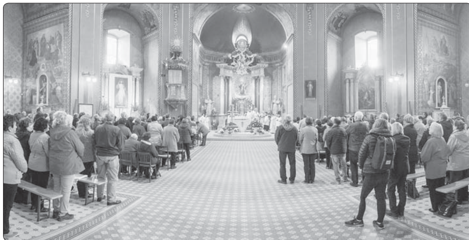
Pouť Matic na Svatém Hostýně