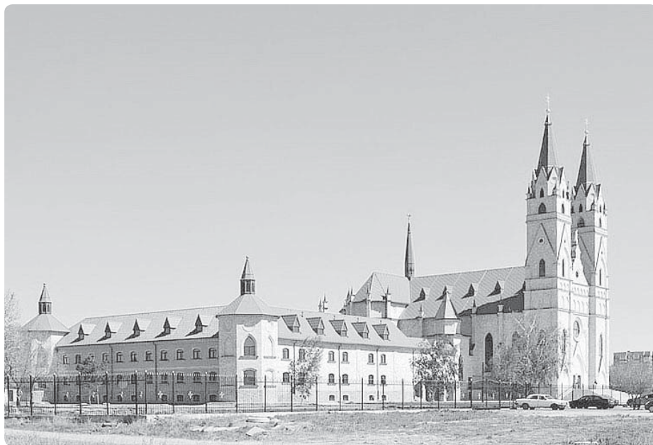
Katedrála Naší Milé Paní z Fatimy, Matky všech národů, v Karagandě

Ale díky důvěře a vytrvalosti této obyčejné rakouské matky vznikla římskokatolická katedrála v novogotickém sty-