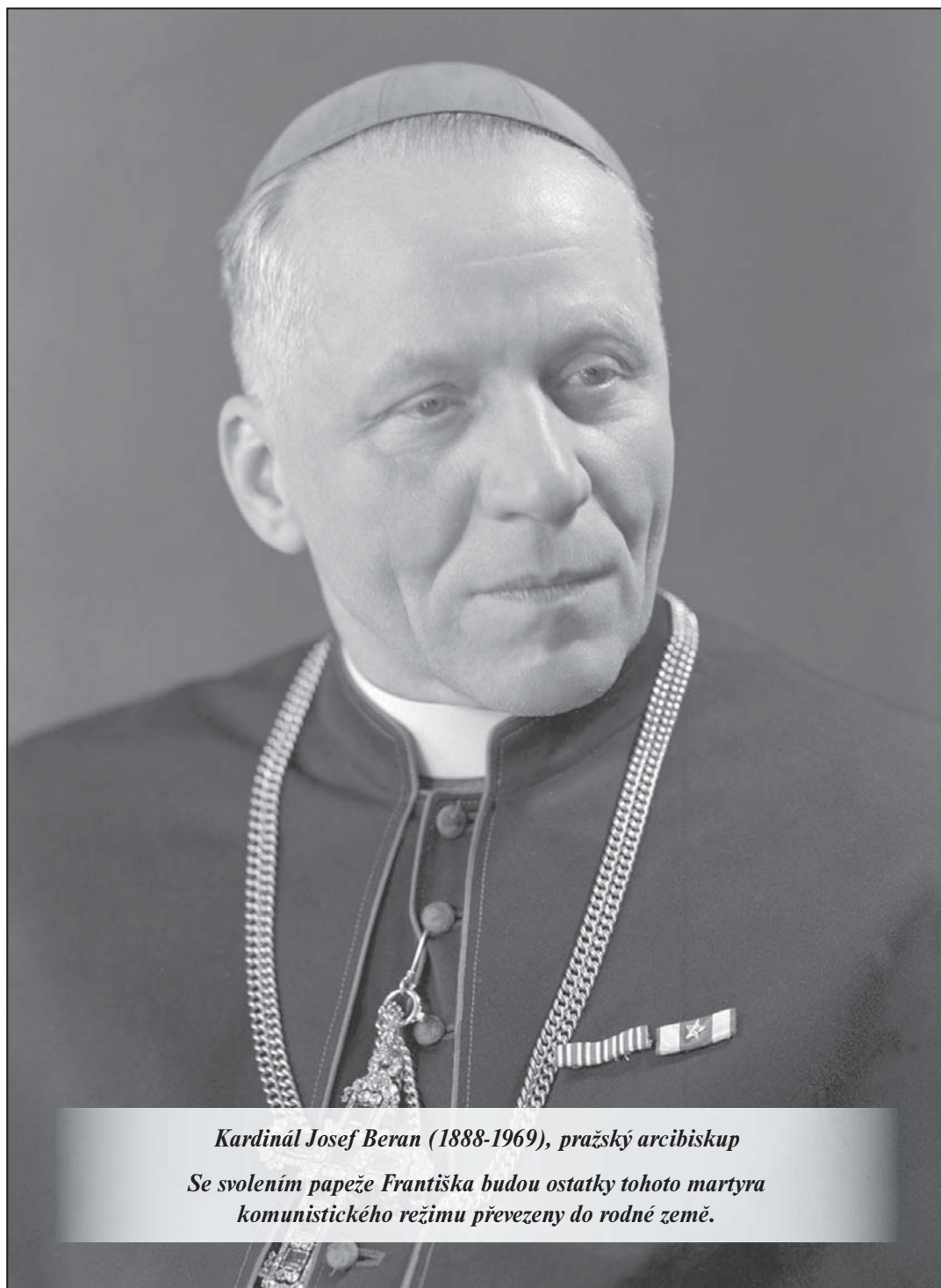
Kardinál Josef Beran (1888-1969), pražský arcibiskup

Se svolením papeže Františka budou ostatky tohoto martyra komunistického režimu převezeny do rodné země.