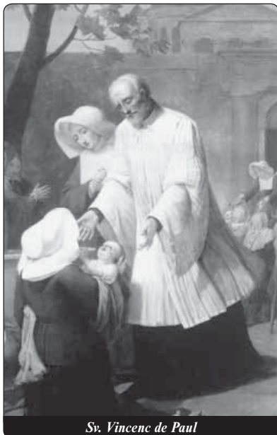
Sv. Vincenc de Paul

Velkou radost mu působily lidové misie, které pořádal se svými duchovními syny. Jednalo se o nový styl pastorační aktivity: 15 dnů kázal v jedné farnosti, hlásal Boží slovo všem a vyučo-