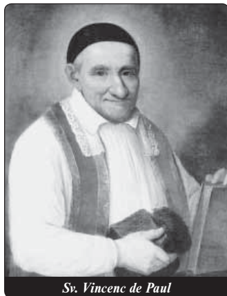
Sv. Vincenc de Paul

ním zakladatelem Charity, která dnes představuje obrovskou sílu ve světě. On byl inspirátorem