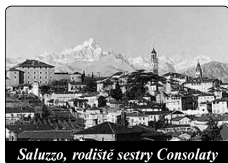
Saluzzo, rodiště sestry Consolaty

Pro mladou sestru je toto jméno příznačné: ještě dříve, než se uskuteční její poslání, bude smyslem jejího života: chce být těšitelkou Ježíšova Srdce a všech těch, kteří jsou schopni vnímat a přijmout Pánovu lásku. Podle toho, co tuší, bude misionářkou, ale na nekonečno. Při obláčce vnímá Boží vnučnutí, které jí určuje cestu: Nežádám od tebe nic jiného než toto: ustavičný akt lásky. A po celých 17 let klášterního života to bude základ, na který se soustředí, který sjednotí její bytost a bude přetvářet každý okamžik jejího života na consumatum est – dokonáno jest. 8. dubna 1934 skládá na Bílou neděli věčné sliby. V klášteře vykonává službu kuchařky, vrátné a příštípkačky. Když se 22. července přestěhuje do nového kláštera v Moriondo Moncalieri, je také ošetřovatelkou a sekretářkou.