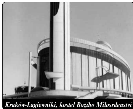
Kraków-Lagiewniki, kostel Božího Milosrdenství

O taková obrácení jde o svátku Milosrdenství. To je svátek velkého Sběrače hadrů. Všichni mají přijít s pytlíkem svých hadrů. Ma-