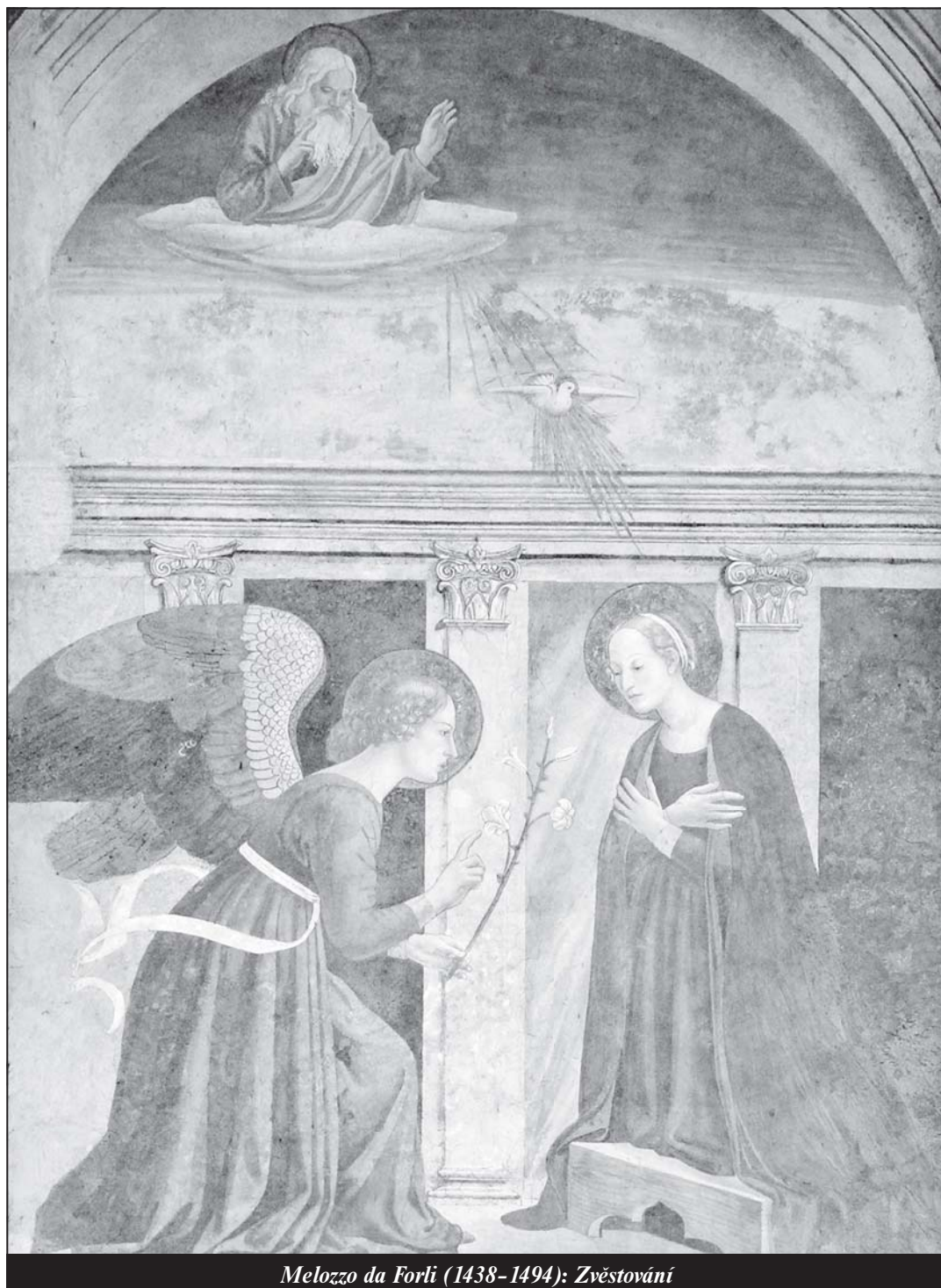
Melozzo da Forlì (1438-1494): Zvěstování