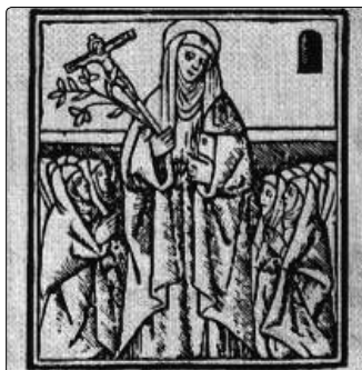
Bl. Anděla z Foligna