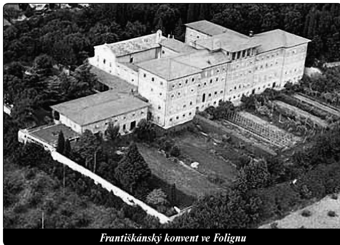
Františkánský konvent ve Folignu

jí vykonat úplnou zpověď a pak přistoupit důstojně k svatě hostině po tolika letech prožitých daleko od Boha a od svatého přijímání. Toto počáteční drama zůstane v Andělině svědomí jako napomenutí pro její život a pro výuku jejích učedníků: Každý člověk se musí přibližovat k tak velkému dobru, k takové hostině s velkou úctou, s naprostou čistotou,