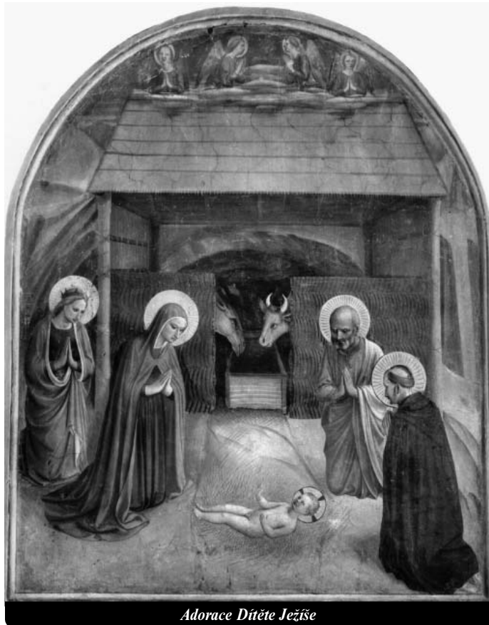
Adorace Dítěte Ježíše