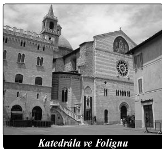
Katedrálá ve Folignu

Třetí proměna obsahuje dva poslední kroky (1294-1296). Skrze radikální očištění vstupuje Anděla do samotného lůna Nejsvětější Trojice. Duše se v dokonalé jednotě přetváří v Boha a Bůh se přetváří v ni. Cítí a prožívá ty nejvyšší věci, které patří jen Bohu a není možno je vyjádřit slovy nebo myšlenkami. V této třetí proměně Bůh vlévá do duše milost zvláštní moudrosti, skrze kterou duše ovládá lásku k Bohu a k bližním, protože čím více je spojena s Bohem, tím méně podléhá změnám. Ale dříve než dospěje k těmto vrcholům mystického života, musí Andělina duše