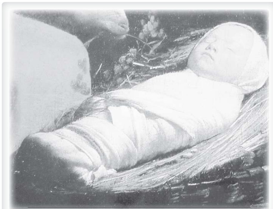
Georges de La Tour (1593–1652): Klanění pastýřů, detail. Tím, že se stal Bůh dítětem, dostalo období dětství oproti minulosti úplně novou důstojnost.

Tak jako je pro dospělého člověka nepřiměřená dětinskost, dětské chování, tak žádoucí musí být pro křesťana opravdové dětství, vždyť je už od doby, kdy se Bůh stal dítětem, teď opravdu cestou imitatio