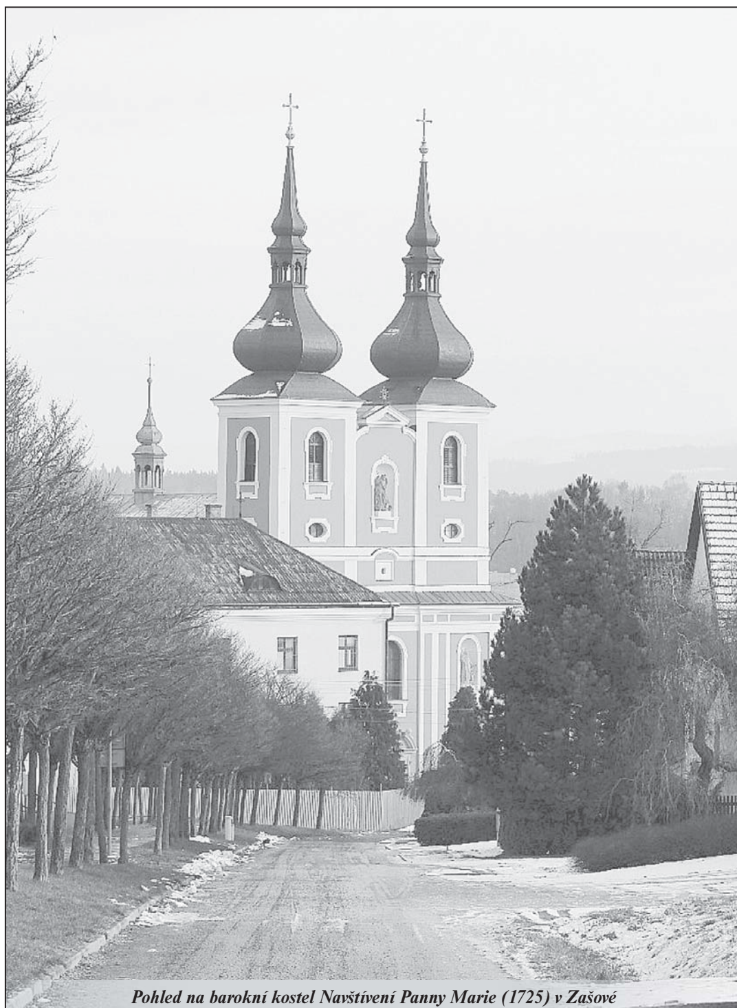
Pohled na barokní kostel Navštívení Panny Marie (1725) v Zašové

Suma o darech svatého Josefa (55) - strana 13 -