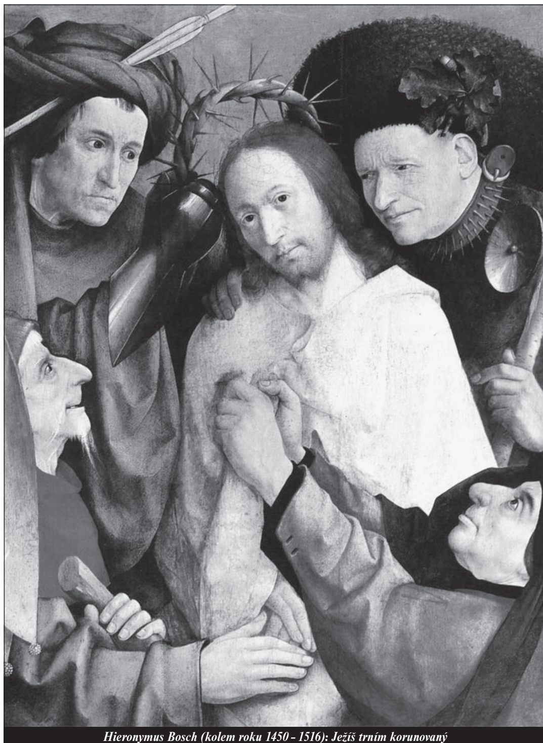
Hieronymus Bosch (kolem roku 1450 - 1516): Ježíš trním korunovaný