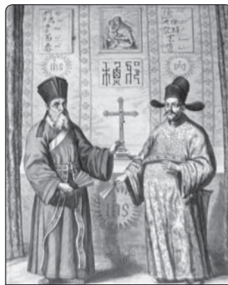
Matouš Ricci a Xu Guangqi