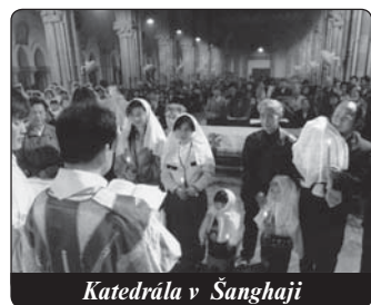
Katedrála v Šanghaji

Když se stal křesťanem, nestáhl se ze světa, neutekl před městy a lidmi, nezamýšlel vytvářet církev jako antagonistickou skutečnost, jako konkurenci světských císařů. Jeho láska a sympatie k lidem naopak zintenzivněla a probouzela naději na odstranění tolikerého zla, které je sužuje. Podle vlastního vzoru vysokého císařského funkcionáře, který se stal křesťanem, zpracovává argumenty na obranu rodícího se čínského křesťanství. Vysvětloval: Misionáři, kteří přišli ze Západu, přinesli s sebou jen dobré věci pro skutečný život lidu, který žije v říši. Nejlepší ze všech pak je Kristovo evangelium, které slibuje osvobození od hříchu a věčnou spásu. Na doplnění tohoto