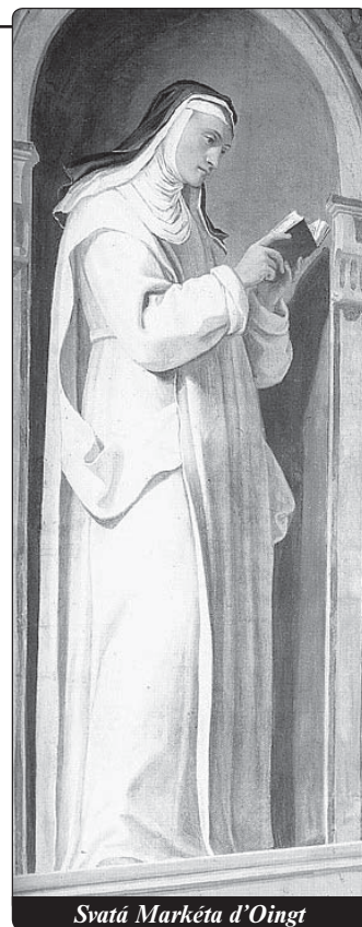
Svatá Markéta d'Oingt

Na první pohled se tato postava středověké kartuziánky, její život, její myšlení jeví velice vzdálené pro nás, pro náš život, pro náš způsob myšlení a jednání. Ale díváme-li se na to podstatné v tomto životě, vidíme, že se to týká i nás, a mělo by se to stát podstatným také pro náš život.