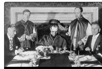
Přijetí významných průmyslníků