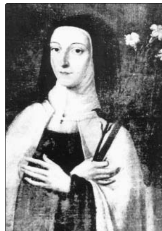
Markéta od Nejsvětější Svátosti

Když jednou lékaři prováděli na její hlavě chirurgický zákrok bez umrtvení, seděla klidně a dívala se na korálky ve své ruce. „Ano, všechno je sladké, když člověk potkává malého Ježíška. Dává mi sílu snášet s trpělivostí všechno to, čeho bych bez jeho milosti nebyla schopná.“ V této její bezmocnosti jí Ježíš ukazuje svou moc. S rozpjatými rukama stojí toto dítě před Bohem a může od něho dosáhnout všechno. Úpěnlivou modlitbou vyprosí Francii následníka trůnu a zachrání město Beaune před nepřátelským útokem. I když žije ve skrytosti Karmelu, stane se matkou pro mnoho lidí, kteří k ní přicházejí a zakouše-