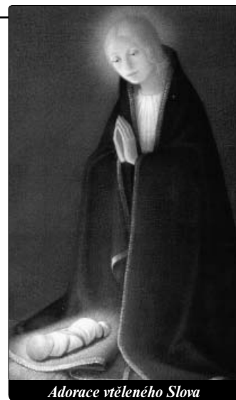
Adorace vtěleného Slova

Ne, nechci, aby se to stalo. Moje lidské Srdce a božství Boha-Člověka odmítají, abych tak řekl, tuto myšlenku, zintenzivňuji své prosby a Já zintenzivňuji zde na zemi oběti pro Církev, abych zachránil své kněze i na okraji propasti a spasil je svou krví, kterou oni svatokrádečně pošlapali. Až do jejich posledního okamžiku, ve kterém jsem stále přítomen, skráním je svou Krví pro zásluhy duší – obětí – zde na zemi, snažím se prorazit k nim svými vzdechy, snažím se pohnout je svou nesmírnou láskou a budu to dělat až do konce věků.