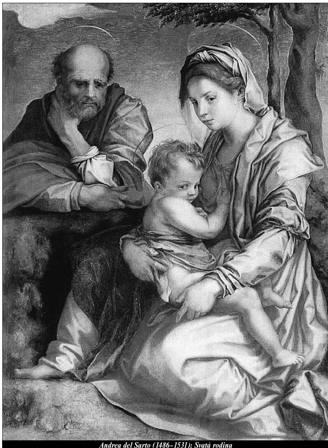
Andrea del Sarto (1486-1531): Svatá rodina

Milostiplný příchod Božího Syna o Vánocích, pevnost víry, jistotu naděje a horoucnost lásky v novém roce všem čtenářům přeje redakce Světla