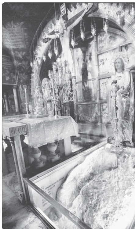
Golgota, místo ukřižování Krista – bazilika Svatého hrobu v Jeruzalémě

umučení Krista, a to hned po oné události. Vědecká zkoumání potvrzují jednoznačně, že texty Nového zákona svědomitě zachycují historická fakta. Ve starověku byly tyto texty nejčastěji opisovány a šířeny. Do našich časů se dochovalo 25 000 rukopisů Nového zákona (pro srovnání: druhá v tom oboru opisování homérovská Iliada se zachovala v 643 rukopisech, z nichž nejstarší pochází teprve z 13. století po Kr.). Tak veliký počet rukopisů umožnil dokonalou rekonstrukci originálu. Tak byla tedy autentičnost knih Nového zákona definitivně potvrzena. Žádný jiný starověký text nemá tak silně potvrzenou svoji shodu s originálem. Máme k dispozici 5 656 rukopisů, které obsahují celý řecký text Nového zákona nebo jeho části, 10 000 rukopisů latinské Vulgáty a 9 300 dalších raných rukopisů. Nejstarší z nich, Magdalenský papyrus (P64), v němž jsou fragmenty evangelia podle Matouše, je datován do roku 60 po Kr. Další rukopis nalezený v sedmé jeskyni v Kumránu, papyrus s řeckým textem (symbol 7Q5) s úryvkem evangelia svatého Marka (6,52–53) pochází bezesporu z doby před r. 68 po Kr. Rukopis nalezený v Egyptě Johnem Rylandsem pochází z roku 130 po Kr.; Bodmerův papyrus II z roku 150 po Kr.; papyry Chestera Beattyho z r. 200 po Kr.; Kodex vatikán-