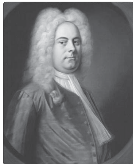
Georg Friedrich Händel

Vesmír, největší mistrovské dílo umělecké tvorby, vzešel ze Stvořitelovy lásky. Proto každý, kdo s otevřeným srdcem pozoruje stvoření, pocítuje něco z této tvořivé lásky našeho Boha. Podobně je to i s posluchači „Mesiáše“, jednoho z nejznámějších barokních oratorií. Kdo by necítil něco z velikonočního jásotu, když uslyší sborové „Aleluja“, anebo nepocítil lásku Dobrého pastýře při duetu „Bude pást své stádo jako pastýř“? Je důležité, abychom věděli, že milostivý účinek tohoto díla je plodem hlubokého utrpení.