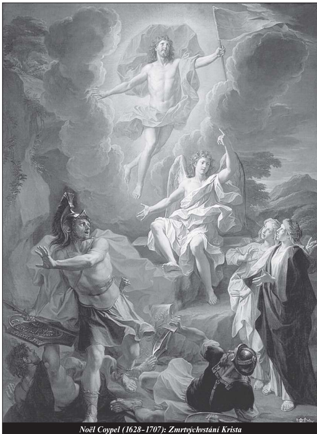
Noël Coypel (1628-1707): Zmrtvýchvstání Krista