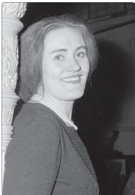
Joan Sutherlandová (1962)

Jen o čtyři roky později ho postihlo ještě větší utrpení. Během tvrdé zimy musel zrušit tolik představení, že nedokázal financovat své hudebníky. Stav vyčerpá-