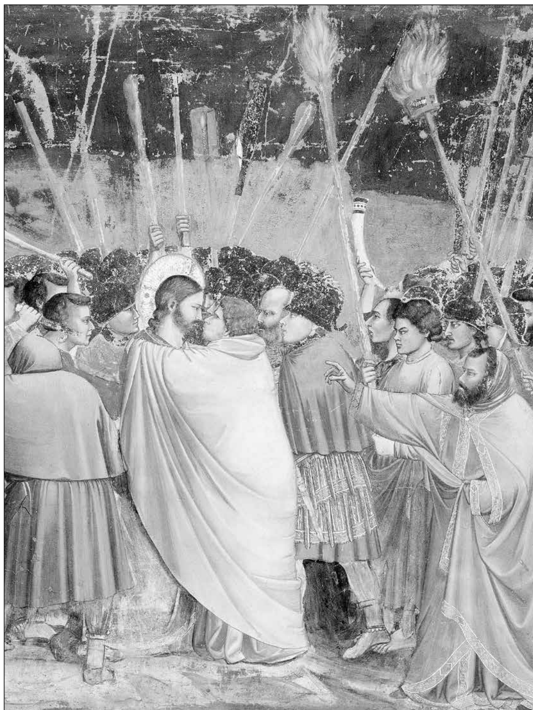
Giotto di Bondone (kolem 1267-1337): Jidášova zrada, Padova, kaple Scrovegniů (viz str. 11)