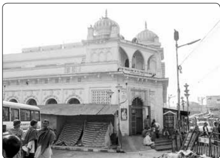
Hospic v Kalighatu

Dne 7. října 1950 se osobně ukázal arcibiskup kalkatský, aby posvětil nově zbudovanou kapli. Před obrazem Neposkvrněného Srdce odsloužil zakládající mši svatou a předčítal při ní také pochvalný dopis papeže Pia XII. Tento den, růžencový svátek roku 1950, platí od té doby za zakládající den Misionářek bliženecké lásky. Všichni členové nového řádu se od té doby rádi modlili růženec.