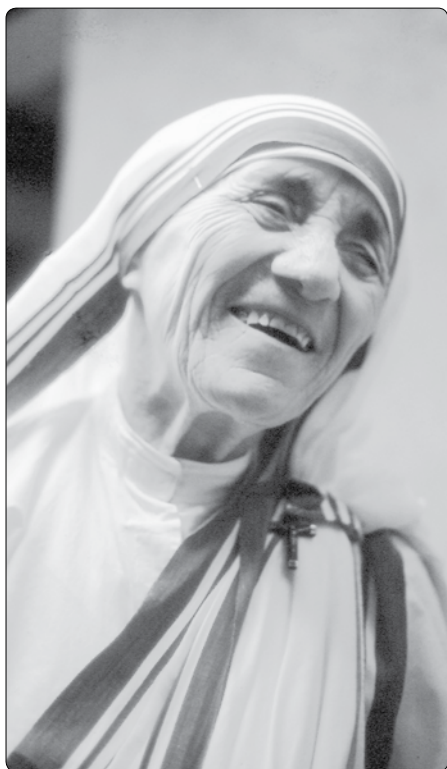
Svatá Matka Tereza