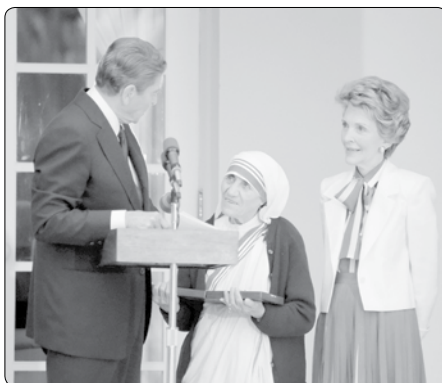
Prezident Ronald Reagan předává Matce Tereze Prezidentskou medaili svobody