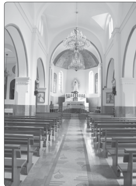
Interiér katolického kostela Matky Boží v Letnici, který Matka Tereza za svého mládí ráda navštěvovala

Z L'Osservatore Romano č. 14, 7. 4. 2016, s. 6