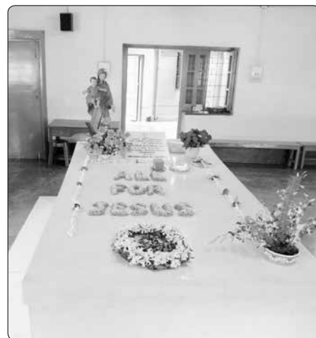
Hrob Matky Terezy v hlavním sídle kalkatského společenství

Od dětství jí byla požehnáním neotřetitelná důvěra v Matku Boží. Vše ke cti Boží, vše k slávě člověkem se stavšího Syna Ježíše Krista, ale nic bez požehnání a pomoci Mariiiny. Podobně jako při svatbě v Káni (srov. Jan 2,1nn) by mohlo být také o životě a díle Matky Terezy napsáno: „Byla tam Ježíšova Matka!“