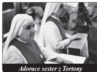
Adorace sester z Tortony

V Tortoně, malém městečku na severu Itálie, je zvláštní klášter. Sestry tohoto společenství jsou nevidomé. V roce 2007 slavily tyto Sacramentarie adoratrici non vedenti 80. jubileum svého založení. Zakladatelem byl svatý Luigi Orione. Jsou odnoží Malých misionářek blížeňské lásky. Středem života těchto slepých sakramentárek je ustavičná adorace před Nejsvětější svátostí. Tím uskutečňují také přání Benedikta XVI., který vidí v Eucharistii střed a pramen své služby. Jejich život je ustavičná modlitba, kterou staví mosty mezi svým modlitebním klekátkem a celým světem. Několik mladších sester se věnuje péči o starší a nemocné spolusestry. Se světem je spojuje také počítač, který má speciální software a skreanreader – monitor, který hmatatelně zobrazuje slepecké písmo. Vždy druhou neděli v září slaví sestry „Svátek světla“. Může se to zdát zvláštní, nevidomé slaví svátek světla: chtějí tím zprostředkovat světu poselství světla – Bůh je světlo, které přemáhá vnitřní slepotu. Podobné kláštery jsou také ve Španělsku, Argentině, Brazílii, Chile a v Keni.