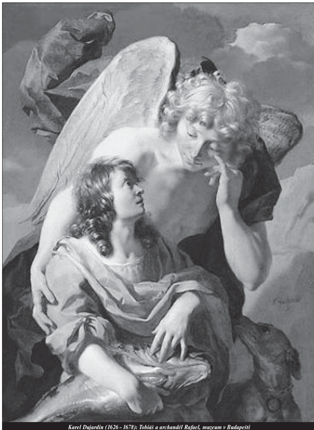
Karel Dujardin (1626 - 1678): Tobiáš a archanděl Rafael, muzeum v Budapešti