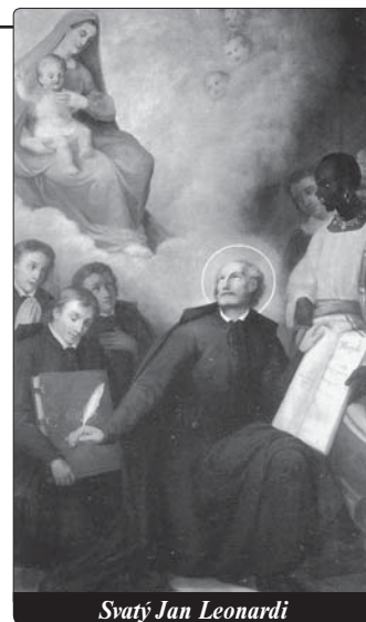
Svatý Jan Leonardí

lostí spásy. Jelikož měl jasné vědomí, že Církev je Boží pole (srov. Mt 13,24-26), nepohoršoval se nad lidskými slabostmi. Aby zvýraznil koukol, zvolil být dobrým zrnem: rozhodl se totiž milovat Krista v Církvi a přispívat k tomu, aby ji činil stále více jeho výrazným znamením. S velkým realismem viděl Církev, její lidskou křehkost, ale také její skutečnost „Božího pole“, Božího nástroje pro spásu lidstva. A nejen to. Z lásky ke Kristu pracoval čile, aby Církev očistil, aby ji učinil krásnější a světlejší. Pochopil, že každá reforma se děje uvnitř Církve, a nikoliv proti Církvi. V tom byl Jan Leonardí opravdu mimořádný a jeho příklad zůstává stále aktuální. Každá