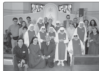
Řeholní komunita sester z Tortony

že tím promarníme svůj život. Ale tak tomu není. Vždyť je to v dnešním materialistickém světě důležité říct svým životem, že Bůh existuje, a je důležité se modlit, aby lidé poznali, že cenu mají nikoliv kariéra a moc, ale především duchovní život.