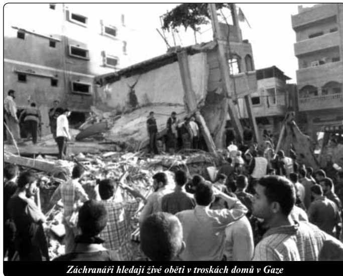
Záchranáři hledají živé oběti v troskách domů v Gaze

Zde v Gaze se neodvažujeme rozlišovat mezi muslimy a křesťany. Celý národ prožívá totéž společné utrpení, my všichni máme stejné úzkosti.