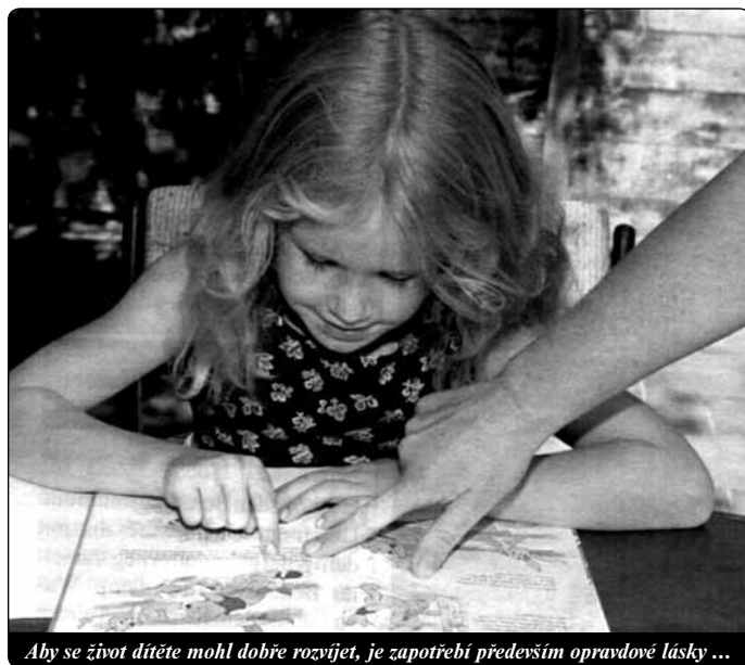
Aby se život dítěte mohl dobře rozvíjet, je zapotřebí především opravdové lásky ...

Na počátku jeho života, když se mozek utváří, musí se láska doslova a do písmene stát jeho výživou: jeho tělesná matka, která je vybavena k tomu, aby ho krmila, musí být tomuto člověku plně k dispozici. Je tím vyjádřeno to, co je nezbytné: ocho-