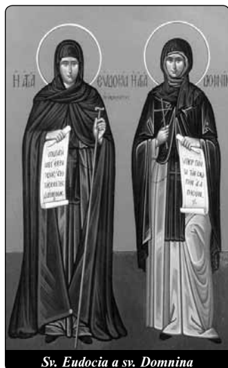
Sv. Eudocia a sv. Dominina

3. Třetí aspekt v syrsko-východní mystice vede opět k podobenství o deseti pannách, kde je řeč o svatební komnatě. Text zní ve svém běžném podání: ty, které byly připraveny, vstoupily (s Ženichem) do svatební síně (Mt 25,10). V jedné z variant syrského textu, který převzali četní autoři, mezi nimi Efrém, čteme „do Ženichovy komnaty“ (gnonô). Vstup do Ženichovy komnaty je klíčovým pojmem, pokud jde o to, popsat nejvyšší stupeň spojení s božským Ženichem. To začíná křtem, a to především u zasvěcených panen, které jsou zasnoubeny Kristu, „Živému“ (Efrém). Vstup