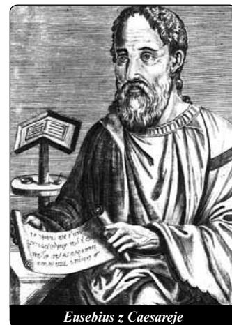
Eusebius z Caesareje

počátku první knihy vypočítává podrobně argumenty, o kterých chce hovořit ve svém díle: Předsevzal jsem si, že sepišu posloupnost svatých apoštolů a uplynulých dob, počínaje naším Spasitelem až k nám; všechny velké věci, které, jak se praví, se staly během dějin Církve; všechny ty, kteří řídili a výtečně vedli nejslavnější diecéze; a ty, kteří během každé generace byli hlasateli Božího slova slovem a písmem; ty, kteří z touhy po novotách upadli do všemožných bludů a stali se vykladači a hlasateli falešného učení a jako draví vlci bezbožně pustošili Kristovo stádo; ... a kolika a jakými prostředky pohané napadali Boží slovo; a velikány, kteří, aby je bránili, prošli tvrdými krvavými zkouškami a mučením; a koneč-