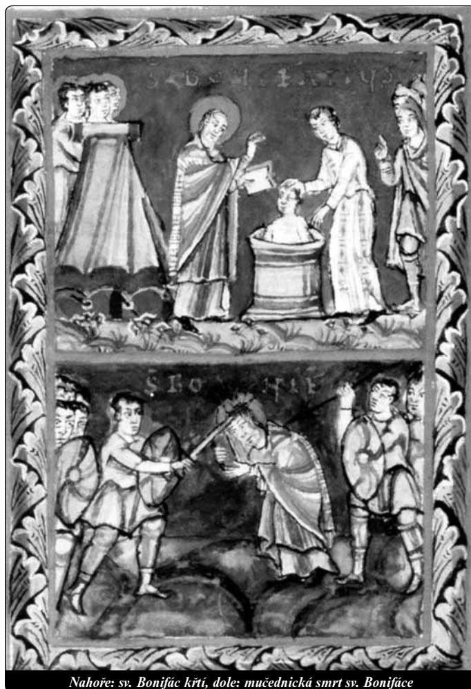
Nahore: sv. Bonifác křtí, dole: mučednická smrt sv. Bonifáce

Winfried se vrátil do Fríska. Tam se připojil k arcibiskupovi Willibrordovi, také anglosaskému misionáři. Dva roky působili spolu, byla to učednická léta, za která zůstal vždy vděčný. Od Willibrorda převzal jednu misijní metodu, kterou si také osvojil: zajistil si ochranu franského vladaře, vyžádal si v Římě papežskou plnou moc a zakládal jako opěrné body misie biskupství