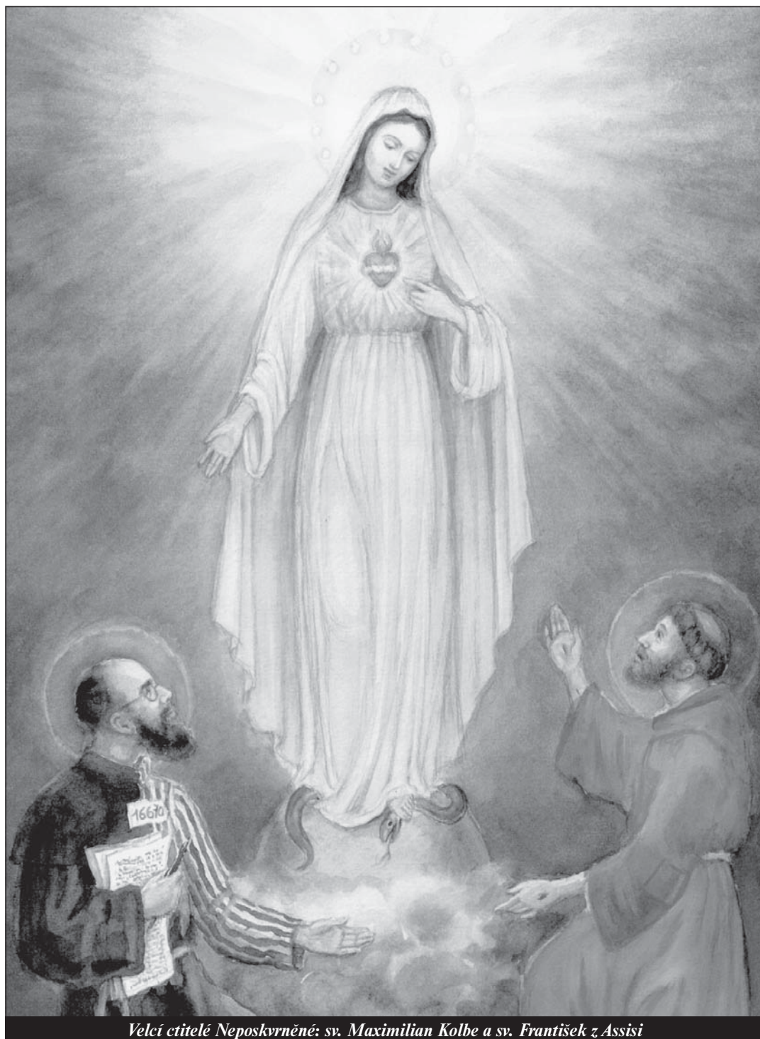
Velcí ctitelé Neposkvrněné: sv. Maximilian Kolbe a sv. František z Assisi