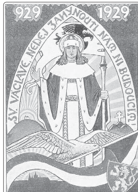
Svatý Václav, patron československé vlasti

Hlásíme-li se k 28. říjnu, uznáváme tím, že náš národ je schopen státní samostatnosti, a to i v současném stupni evropské integrace, nebo i jemu navzdo-