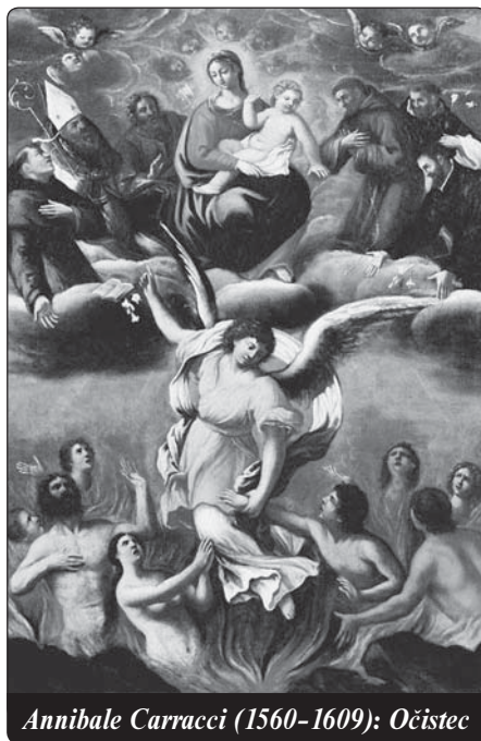
Annibale Carracci (1560–1609): Očistec

Musí se vzít v úvahu ještě jeden důležitý rozdíl: V pekle není žádná naděje. Je to „místo“ zoufalství. Ubohé duše v očistci ale mají jistotu dobrého konce, takzvanou jistotu spásy, protože jednou – „kdy“ a „za jak dlouho“ je jim ovšem utajeno – opustí místo očišťování a nebe se jim otevře. Mají také jednu velkou přednost před námi, kteří jsme ještě na zemi: už nemohou hřešit. Nemohou už ztratit stav milosti, což se jinak může stát všem v „bojující církvi“. Samotní světcí se ještě mohou stát hříšníky. Pro nás platí po všechno čas: „Pracujte s úzkostlivou bázňí o to, abyste došli spásy!“ (viz Flp 2,12) V očistci už tento strach odpadá.