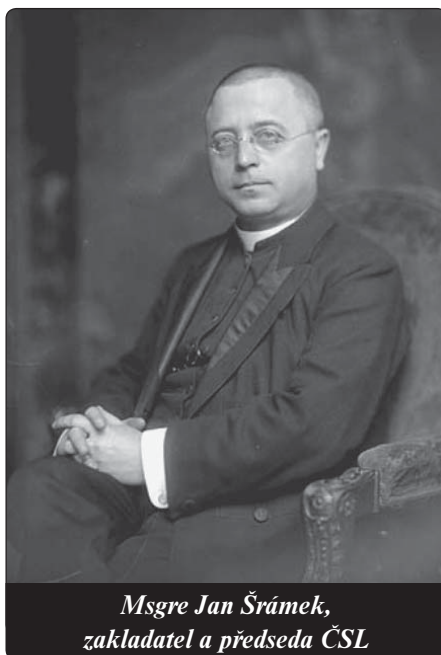
Msgr. Jan Šrámek, zakladatel a předseda ČSL

díme jejich selhání v politických, morálních a jiných případech – např. španělský král Juan Carlos a jeho podíl na tvorbě liberálního politického systému s účastí protikřesťanských a protinárodních politických stran (komunistické a socialistické) ve Španělsku po roce 1975. Dnešní monarchové představují ve svých zemích symbol, užívají si své vydržené postavení a praktickou politiku přenechávají profesionálům. Vzbudí se jejich zděděné rytířství, když na západní Evropu dotírají islám, radikální revoluční ideologie, kultura smrti? Nakolik soucítí se svým lidem, jazykem? Jistě nelze paušálně lámat hůl na všechny. Úctyhodnými panovníky jsou např. bývalý belgický král Baudouin I. nebo současný dědičný kníže lichtenštejn-