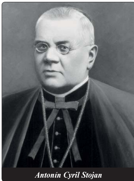
Antonín Cyril Stojan

díme jejich selhání v politických, morálních a jiných případech – např. španělský král Juan Carlos a jeho podíl na tvorbě liberálního politického systému s účastí protikřesťanských a protinárodních politických stran (komunistické a socialistické) ve Španělsku po roce 1975. Dnešní monarchové představují ve svých zemích symbol, užívají si své vydržené postavení a praktickou politiku přenechávají profesionálům. Vzbudí se jejich zděděné rytířství, když na západní Evropu dotírají islám, radikální revoluční ideologie, kultura smrti? Nakolik soucítí se svým lidem, jazykem? Jistě nelze paušálně lámat hůl na všechny. Úctyhodnými panovníky jsou např. bývalý belgický král Baudouin I. nebo současný dědičný kníže lichtenštejn-