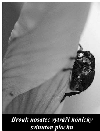
Brouk nosatec vytváří kónicky svinutou plochu

ský matematik, fyzik a astronom Huygens († 1695), který zdůvodnil to, co před ním matematici mnoha staletí objevili na základě svých tvořivých schopností. Čtyřmilimetrový brouček, jehož mozek by měl na špičce špendlíku ještě dost místa, těžko sám