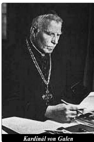
Kardinál von Galen

13. září 1933 byl farář Clemens von Galen ve věku 55 let jmenován Piem XI. biskupem v Münsteru. V souladu se svým