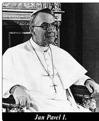
Jan Pavel I.

Když jí bylo 11 let, ztratila otce, několik bratrů a sester, kteří umřeli na následky cholery.