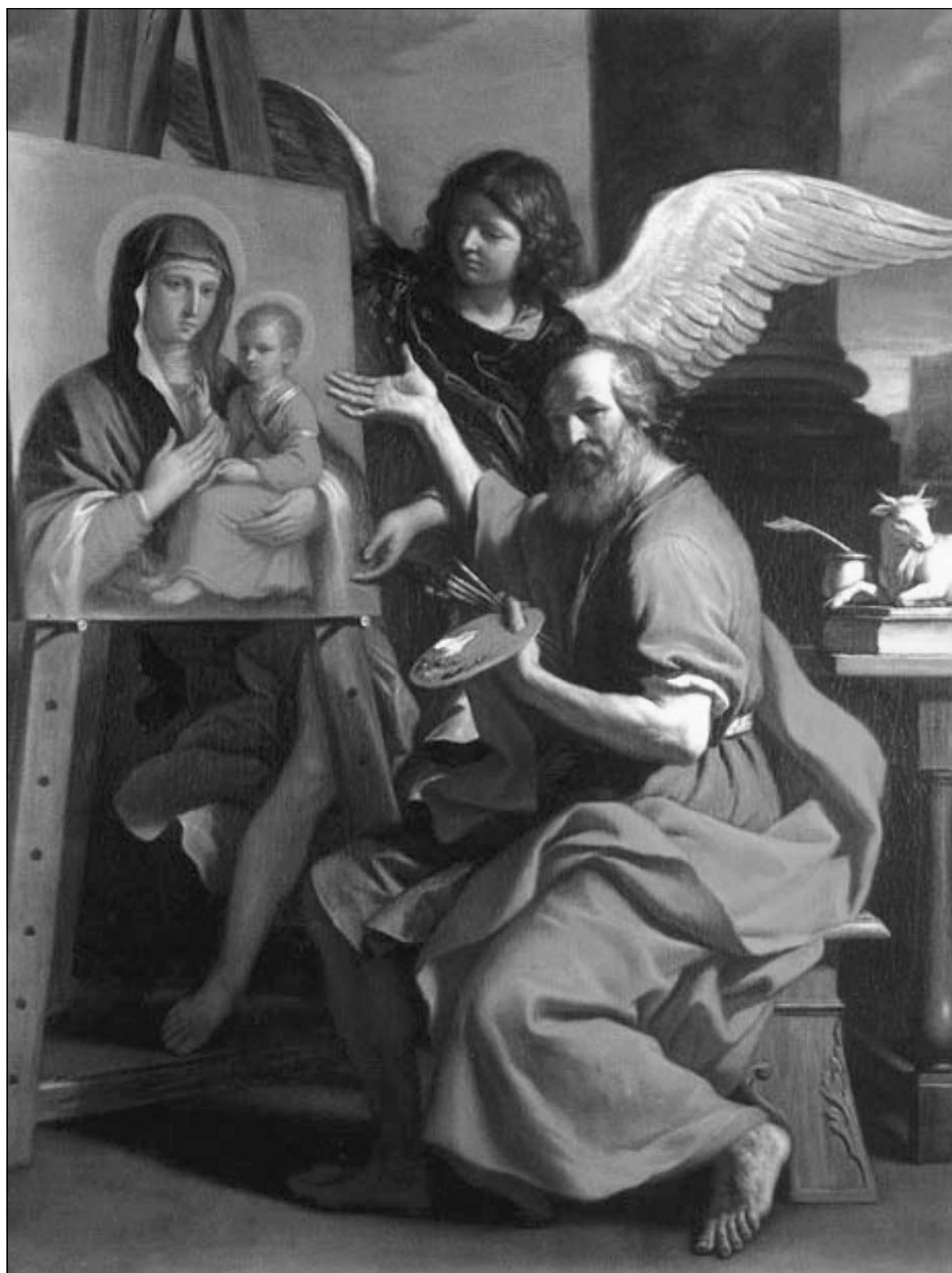
Giovanni Francesco Barbieri (1591-1666): Evangelista sv. Lukáš, Bologna