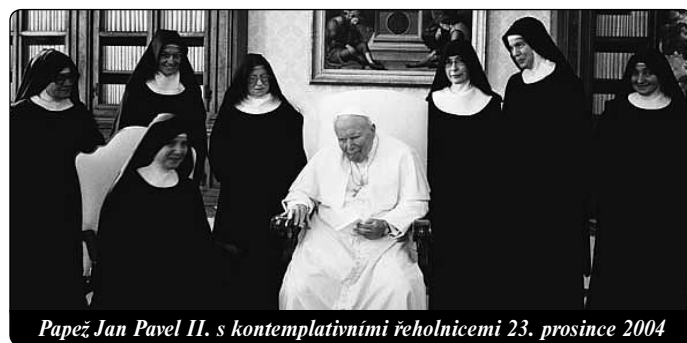
Papež Jan Pavel II. s kontemplativními řeholicemi 23. prosince 2004