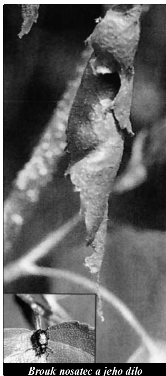
Brouk nosatec a jeho dílo