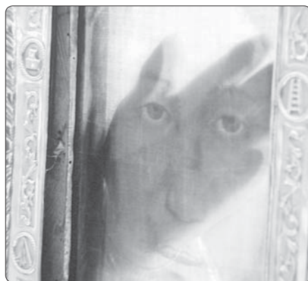
Průsvitnost materiálu roušky – byssového hedvábí

V manoppellské bazilice byla roku 1999 otevřena stálá expozice věnovaná obrazu Svaté Tváře. Tam mohou návštěvníci tuto superimpozici na vlastní oči interaktivně testovat posouváním tří rozměrných průhledných panelů a jejich