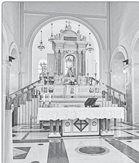
Rouška je umístěna v nasvětleném relikviáři nad hlavním oltářem