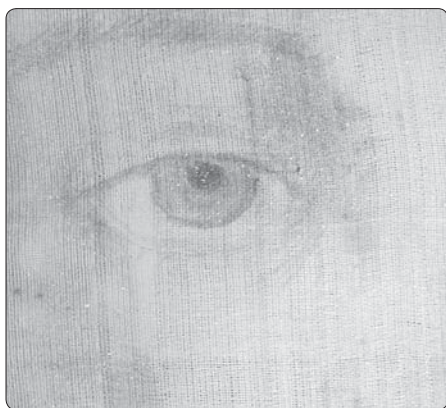
Detail pravého oka na roušce z Manoppella

Superimpozice tváře mrtvého Ukřižovaného z Turínského plátna a tváře Vzkříšeného z manoppellského závoje má překvapivý výsledek. Můžeme říci, že je