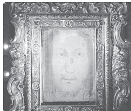
Relikviář s rouškou z Manoppella

Těm, kteří pravost roušky z Manoppella zpochybňují, ovšem nahrává fakt, že tento tajemný předmět dosud nebyl podroben všestrannému vědeckému testování (které například v případě Turínského plátna