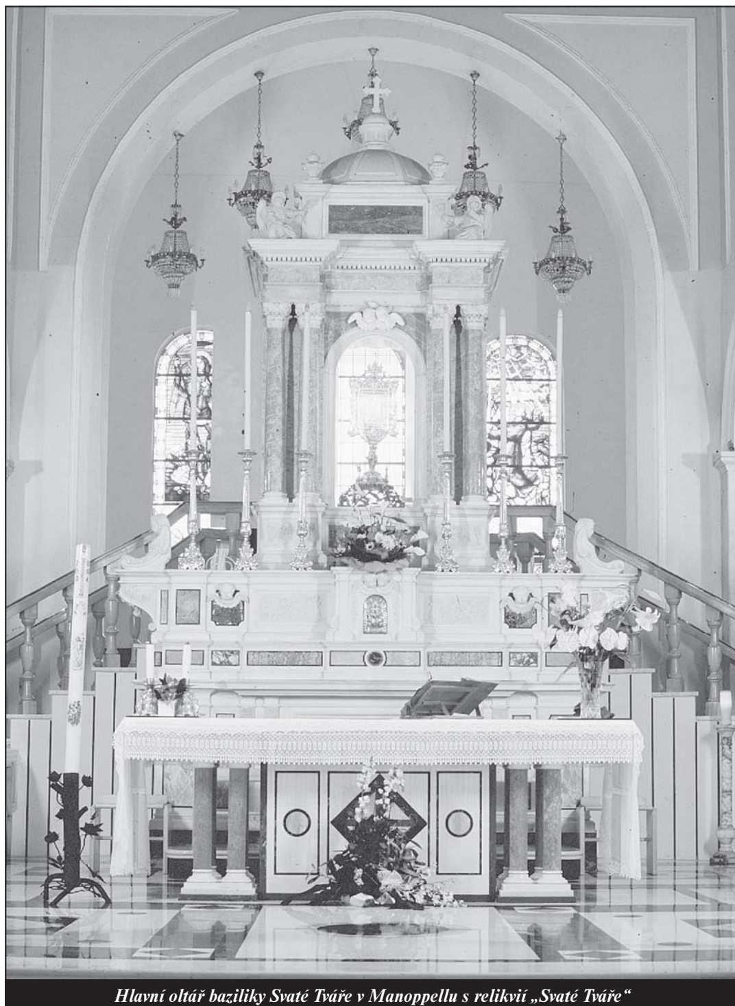
Hlavní oltář baziliky Svaté Tváře v Manoppellu s relikvií „Svaté Tváře“