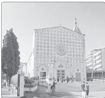
Bazilika Svaté Tváře v Manoppellu, kde je rouška uchovávána