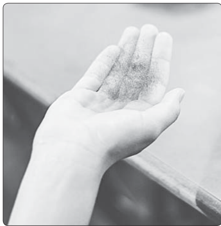
Vlákna, ze kterých se tká příže byssového hedvábí

Textilie, která nese obraz, je utkána z příže získané z tzv. byssového neboli mořského hedvábí. Pojmeme byssus se označují vlákna z chapadel mušlí pinna nobilis – z jednoho exempláře se dají zís-