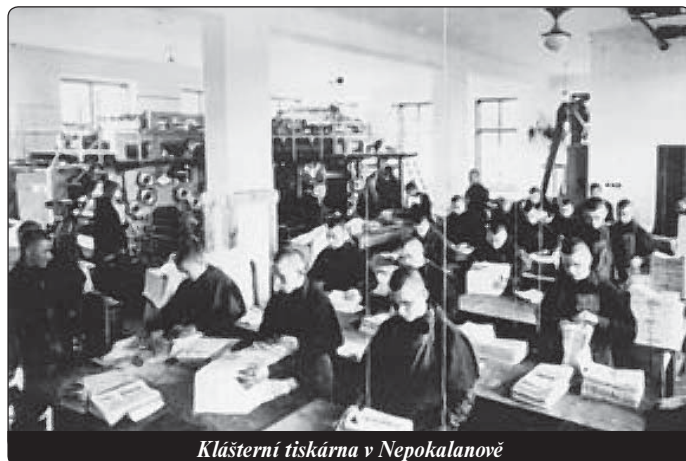
Klásterní tiskárna v Nepokalanově

Pramen: Święci na każdy dzień , Wydawnictwo Salezjańskie