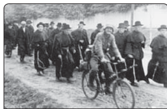
Deportace františkánů z Nepokalanova do koncentračního tábora

Náklad Rytíře Neposkvrněné dosáhl 750 000 výtisků, Malý rytíř pro děti 221 000 exemplářů, Malý deník měl 137 000 exemplářů a jeho nedělní vydání 225 000. Od roku 1938 měl klášter svůj vlastní rozhlasový vysílač. Nebylo to ovšem bez těžkostí. Volnomyšlenkářský tisk dělal všechno možné, aby toto dílo zesměšnil a odradil od něho lidi, ale dílo Neposkvrněné překonávalo všechny překážky.