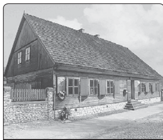
Rodný dům M. Kolbeho dnes slouží jako muzeum

Rodiče byli členy III. řádu svatého Františka. Otec byl velkým vlastencem a rád čítal svým synům vlastenecké knížky. Chlapci, „nakaženi“ touto četbou, si rádi hráli na rytíře a kreslili na plotech orlice. První ználosti získávali v rodinném domě.