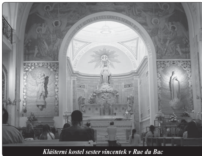
Klášterní kostel sester vincentek v Rue du Bac

Je pravděpodobné, že Kateřina nerozuměla zcela tomuto poselství. Pochopila však, že musí mluvit se zpovědníkem, ona, která se tak těžce vyjadřovala, a právě s lazaristou, člověkem, který měl v krvi tolik skepse, který zcela přehlížel klášterní kandidátku a který neměl o žádná poselství zájem.