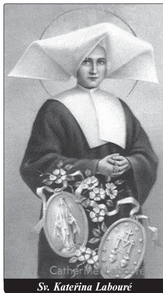
Sv. Kateřina Labouré

Kateřina by byla ráda podstoupila jakoukoliv jinou obět, třeba i velmi těžkou, jen ne mluvit. Ale udělala to, protože to chtěla Panna Maria.