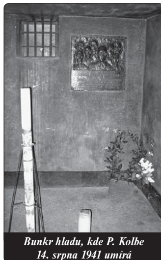
Bunkr hladu, kde P. Kolbe 14. srpna 1941 umírá

Otec Maxmilián se vrátil právě do vlasti, aby podpořil polský Nepokalanov, který v době jeho nepřítomnosti prožíval krizi. Ale sotva všechno začalo opět v původní dynamice, vypukla druhá