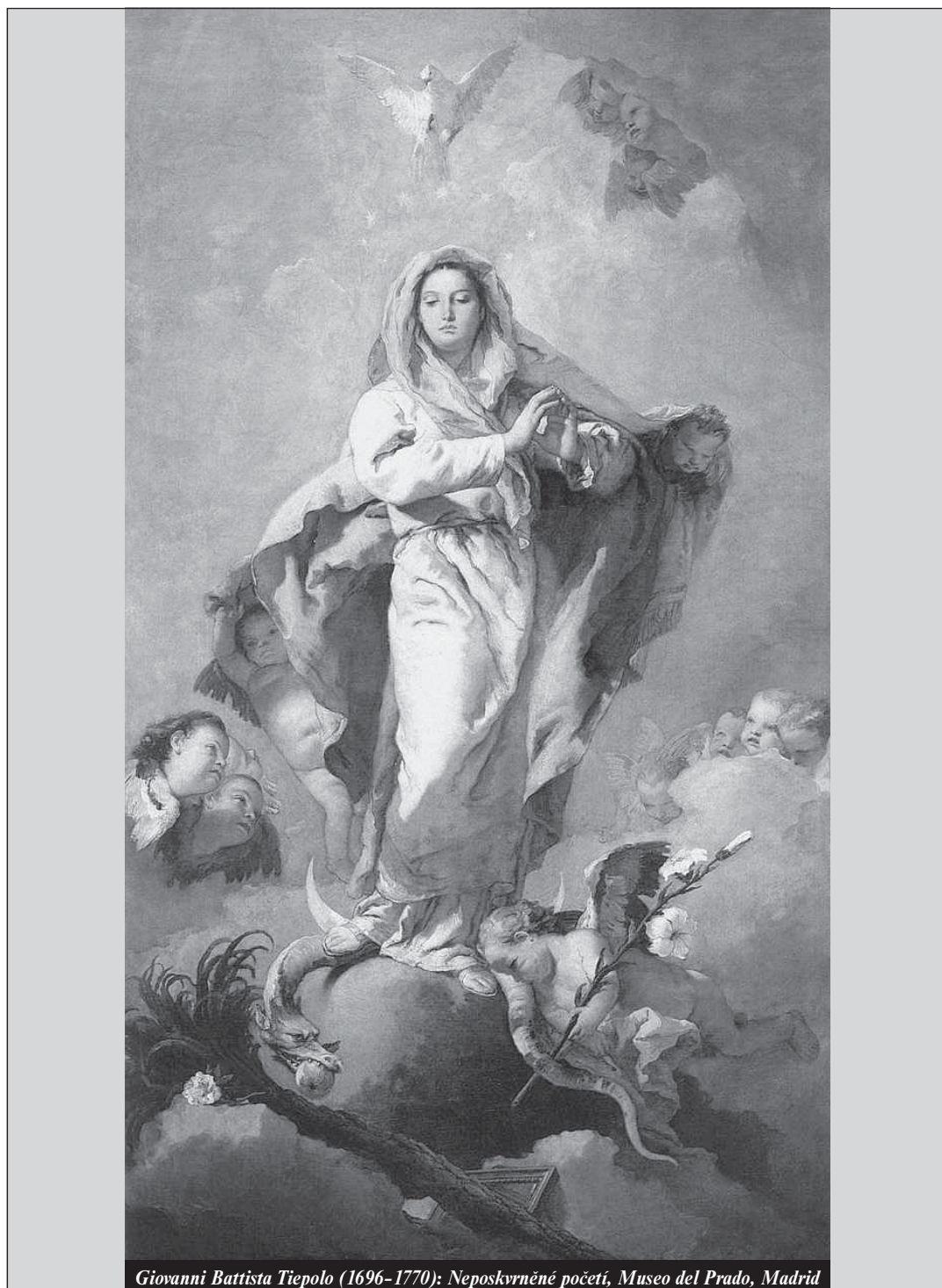
Giovanni Battista Tiepolo (1696–1770): Neposkvrněné početí, Museo del Prado, Madrid