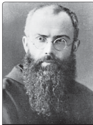
P. Maxmilián Maria Kolbe

ukončil osmou třídu gymnázia, představení ho vzhledem k jeho velkému nadání poslali r. 1912 studovat do Říma na papežské univerzitě Gregorianum. Bydlel v mezinárodní koleji Sera-