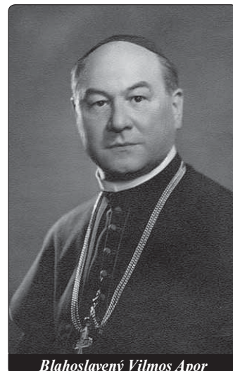
Blahoslavený Vilmos Apor

Na otázku, zda nemá bolesti, odpověděl: „Děkuji Ježíši, že mohu trpět na Velký pátek!“ Sa-