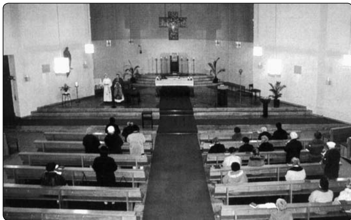
Důstojné chrámy nebyly nikdy tak opravené, ale také nikdy tak prázdné jako dnes

dělat daňové podvody, přejídat se, zneužívat alkohol a tabák, ale hřešit ve smyslu, jak to chápe Církev podle svých a Božích přikázání, to už nejde, protože tato přikázání nikdo ani pořádně nezná. Potrat je (nemocenskou pokladou placený) anti-