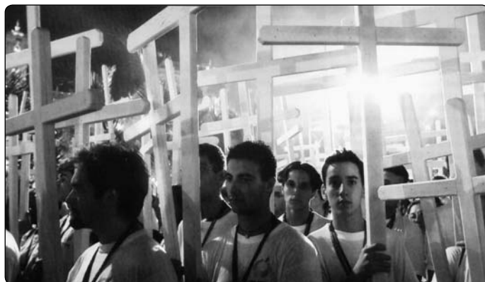
Společnost, která znovu upadla do pohanství, je jako kontrastní fólie, od které by se mohlo křesťanství zářivě odrážet

koncepční prostředek, prožívání homosexualita lidské právo, rozvod normální věc, nevěra lidová zábava. Jako nejvyšší přikázání figuruje tolerance. Křesťanské obyčeje nejsou nežádoucí,