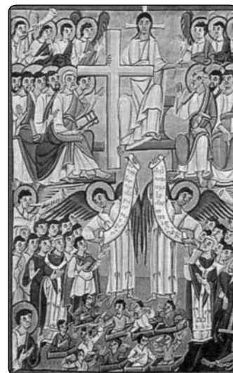
Apokalypsa (ze středověkého breviáře)

aby ses na mě nedíval jinak než skrze Tvář Ježíšovu a skrze jeho láskou planoucí Srdce.“