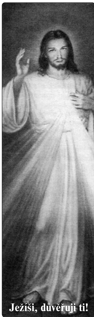
Ježíši, důvěřuji ti!

Během všech let své pastorační péče jsem udělal zkušenost, že není většího daru a větší ctnosti než hluboká srdečná důvěra v dobrotivou Boží prozřetelnost, pro kterou není nic nemožného.