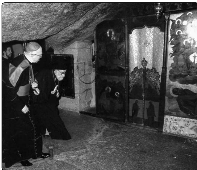
Jeskyně na ostrově Patmos, ve které podle tradice měl apoštol sv. Jan vidění, jež jsou zaznamenána v Apokalypse

Boží pohled na nás, na náš svět jde vždy skrze Beránka, skrze Kristův Kříž. Terezička se modlí ve své zázračné modlitbě k milosrdné Lásce: „Jelikož jsi mě tak miloval, že jsi dal svého Syna, aby byl mým Vykupitelem a mým Snoubencem, tak jsou mé i nekonečné poklady jeho zásluh a já Ti je s radostí předkládám a prosím Tě naléhavě,