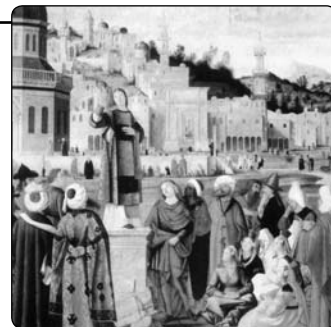
Kázání sv. Štěpána. Výzva překonat nevěřící úžas a zeď pochybností, odmítání i nepřátelství, to jsou všechno „standardní situace“ v Novém zákoně