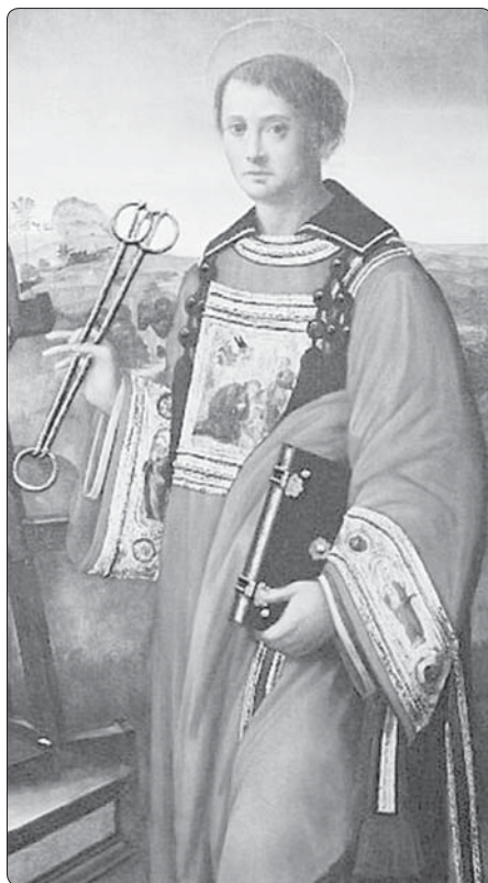
Svatý Leonard z Limoges

Ze všeho nejvíce se ale Leonard proslavil svým vztahem k vězňům a zajatcům. Řeč je o časech, kdy se s nimi nakládalo velice drsně, výjimkou nebylo mrzačení, pravidlem bylo, že dleli celé roky v řetězech v zatuchlých temných kobkách, kde vládly příšerné podmínky (nejen ty hygienické), odkázání na své příbuzné, kteří jim nosili potravu, i na náladovost svých krutých žalárníků. Už v dobách, kdy ještě pobýval na Chlodvíkově dvoře, se jich Leonard opakovaně zastával a mnohé z nich vykoupil. Stejně nakládal s peněžními dary, jež dostával od těch, kteří připutovali k jeho poustevně. Vysvobození jeho zásluhou se dočkala i spousta zajatců, které při-