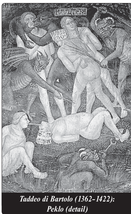
Taddeo di Bartolo (1362-1422): Peklo (detail)

Po přečtení toho otřesného svědectví je třeba si uvědomit, že se skutečně týká pravd naší víry: člověku je dána možnost dobrovolně se odsoudit do věčného a nepopsatelného neštěstí skrze stejně tak dobrovolné a vědomé odmítnutí věčného štěstí, kterým je Bůh. Ve chvíli přejití z tohoto světa na věčnost padne poslední