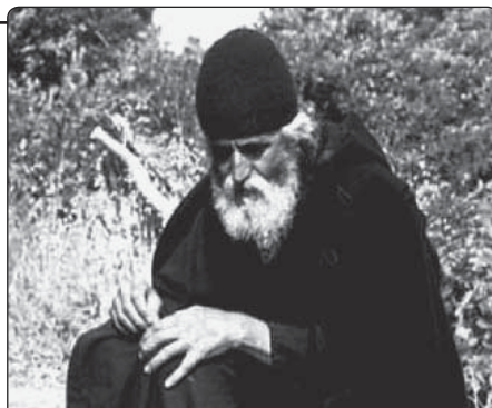
Otec Païssios z hor Athos

Někteří ochraňují s přátelskou falešnou zbožností bludaře a jejich bláznivé