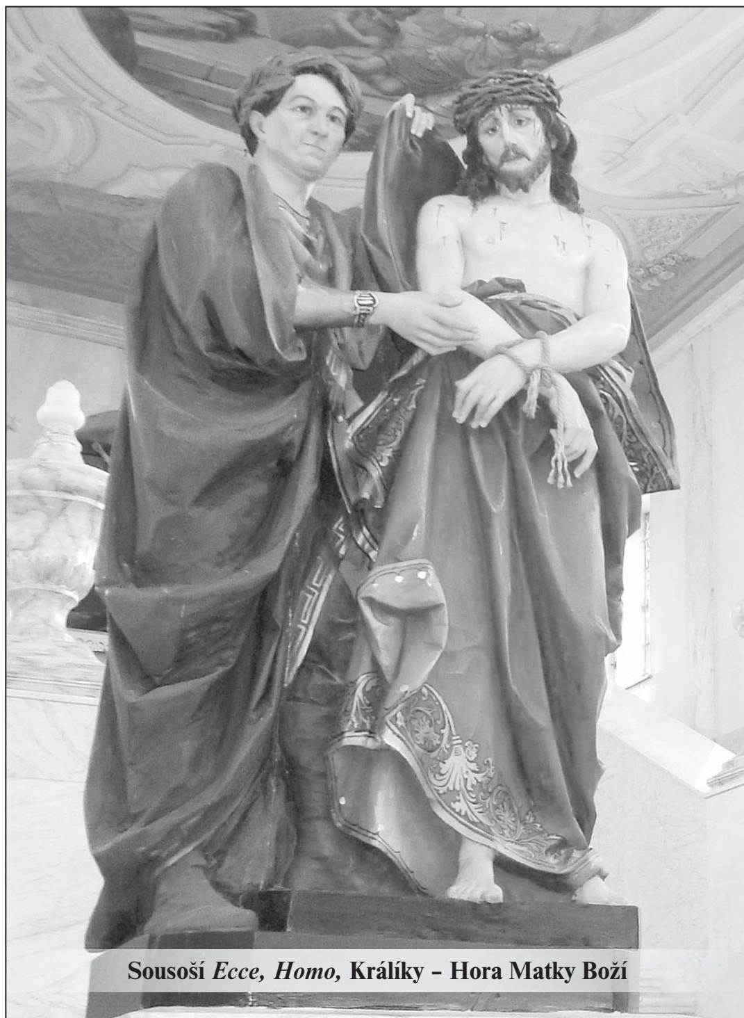
Sousoší Ecce, Homo , Králíky - Hora Matky Boží