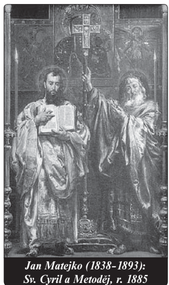
Jan Matejko (1838–1893): Sv. Cyril a Metoděj, r. 1885

Kěž by křesťané častěji uvažovali o spásném napomenutí prvního papeže: Žijte v bázni po dobu svého vyhnanství. Víte přece, že jste ze svého prázdného způsobu života, jak jste ho zdědili po předcích, byli vykoupěni ne snad nějakými věcmi pomíjejícími, stříbrem nebo zlatem, ale drahou Krví