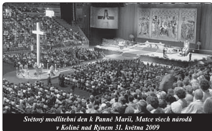
Světový modlitební den k Panně Marii, Matce všech národů v Kolíně nad Rýnem 31. května 2009