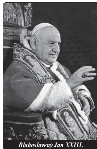
Blahoslavený Jan XXIII.

Jestliže letmo pohlédneme na úžasné pokroky, jakých dosáhla Církev na poli liturgické zbožnosti ve spásném souladu s rozvojem své víry a v pronikání do božských pravd, je nesporně potěšující, když můžeme konstatovat, že ve staletích, která jsou Nám nejbližší, nechybělo ze strany tohoto Svätého stolce jasných projevů souhlasu a povzbuzení pro všechny tři druhy výše jmenovaných pobožností: tyto druhy úcty byly praktikovány od středověku mnoha dušemi a rozšířily se v různých diecézních rádech a kongregacích, ale očekávaly od Petrova stolce