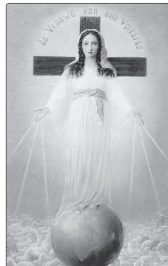
Panna Maria, Matka všech národů

Miliardy lidí nevědí nic o Ježíši, svém Vykupiteli, a o moci Kříže. Velká část lidí neví, že Maria je jejich zcela osobní Matkou. Můžeme si to zodpovědět? Z celé zeměkoule, od nejvýchodnějšího Japonska až k západní Kanadě, od nejsevernější Sibíře až k jižním cípům Ohnivé země ví civilizovaný svět z médií o nebezpečích, která ohrožují život,