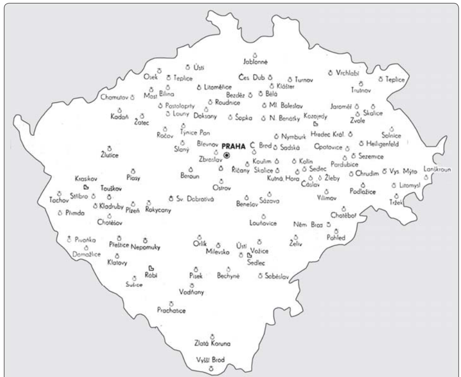
Zničené a vypálené kláštery v Čechách za husitských válek

Hluboké rány utřžila víra i zem. Husitskou kulturní a kultovní revoluci odneslo v Čechách a na Moravě přes 170 klášterních chrámů a klášterů samotných, které byly vypleněny a nadobro zničeny. Hu-