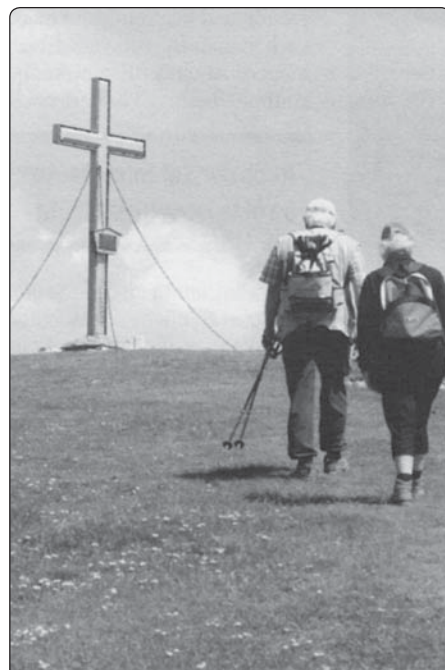
Kříž na veřejném prostranství se stává stále více pohoršením

Když se dnes mluví o náboženství, nepřipustí se samo náboženství ke slovu, ale vymezí se mu rámeček, uvnitř něhož se smí podávat. „Nábožensky správná“,