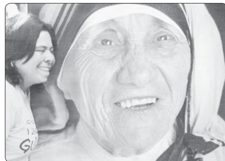
Festival povolání, Světové dny mládeže 2011

ta bolest kvůli ztrátě – kvůli temnotě – kvůli tomu podivnému trápení těch deseti let. Dnes moji duši přeplňuje láska, nevypověditelná radost – ničím nezkalené milostné sjednocení.“