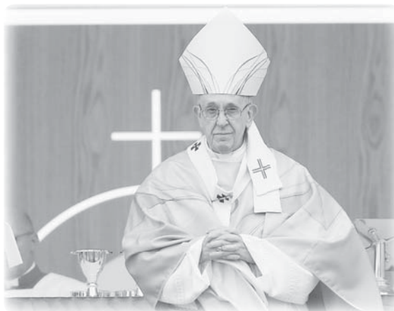
Papež František při mši svaté na Světovém setkání rodin 26. srpna 2018 v irském Dublinu

tého. Jejich každodenně dosvědčovaná věrnost Kristu uchvátila srdce, vroucně toužící po slovu milosti, a přispěla k vytvoření evropské kultury. A toto svědec-