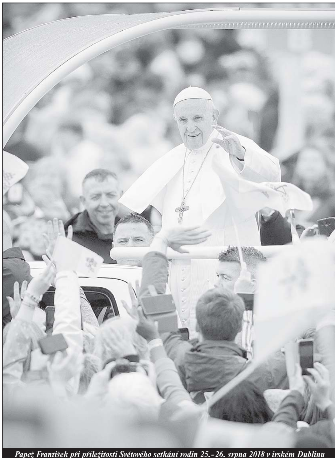
Papež František při příležitosti Světového setkání rodin 25.-26. srpna 2018 v irském Dublinu