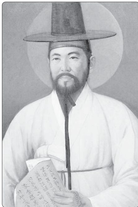
Sv. Pavel Chŏng Ha-sang

Pár dní nato si v Beránkově krvi vypral dobřela své roucho sv. Josef Im Ch'i-p'ek . Narodil se v roce 1804 a byl jedním z těch, kdo sice formálně v Krista věřili, víru však nepraktikoval. Nijak mu to ale nebránilo s křesťany se scházet a podle potřeb jim pomáhat. To byla i motivace jeho vstupu k policii v roce 1835. Když byl v roce 1846 spolu se sv. Ondřejem Kimem Tae-gonem zatčen také Im Ch'i-p'ekův syn, vydal se jeho otec orodovat ke gubernátorovi za jeho propuštění. Byl však sám poslán za mříže, kde se setkal se sv. Ondřejem, který jej tam pokřtil jménem pěstouna Páně. Hned poté se Josef začal svou vírou veřejně pyšnit a odmítal se jí vzdát, byť mu za to bylo slíbeno propuštění, byť byl nemilosrdně