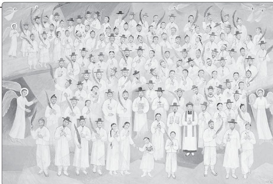
Svatí korejští mučedníci, orodujte za nás!