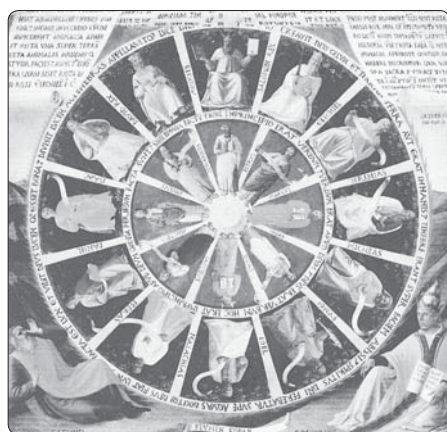
Fra Angelico namaloval okolo roku 1452 desku v kostele Santissima Annunziata ve Florencii. Témata jsou symbolická. Mystický kruh je zobrazením nebe podle knihy Ezechielovy. Vnější kruh zobrazuje proroky, vnitřní evangelisty a apoštoly.

Z Der Fels 2/2018 přeložil -mp- (Redakčně upraveno)