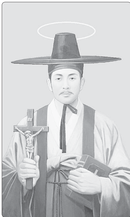
Sv. Ondřej Kim Tae-gŏn