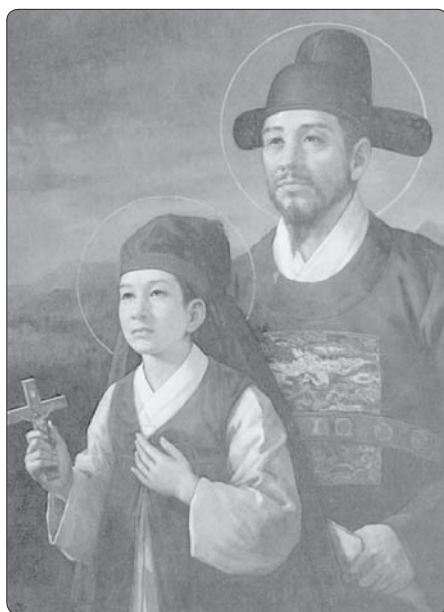
Sv. Petr Yu Tae-ch'ol se svým otcem sv. Augustinem Yu Chin-gilem

týrán (např. ho surově tloukli pověšeného hlavou dolů). Když nepovolil, vynesl nad ním soudce k jeho velké radosti smrtelný ortel. Policejní velitel se někdejšího podřízeného pokusil ještě jednou zlomit, přikázal proto svým mužům vpravovat Josefovi do nohou násilím šrouby, takže nelidským způsobem týraný ubožák řval bolestí. Velitel se chytil příležitosti a prohlásil, že tento křik chápe jako projev zřeknutí se Krista. Od toho okamžiku nevydal Josef ani hlásku, ač věznitelé svá muka ještě vystupňovali. Dne 20. září