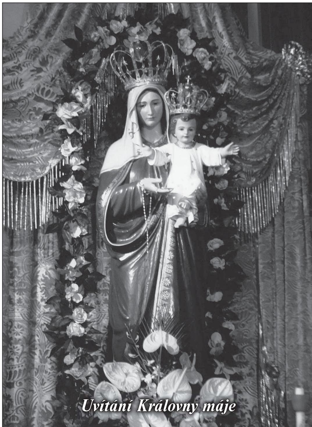
Uvítání Královny máje