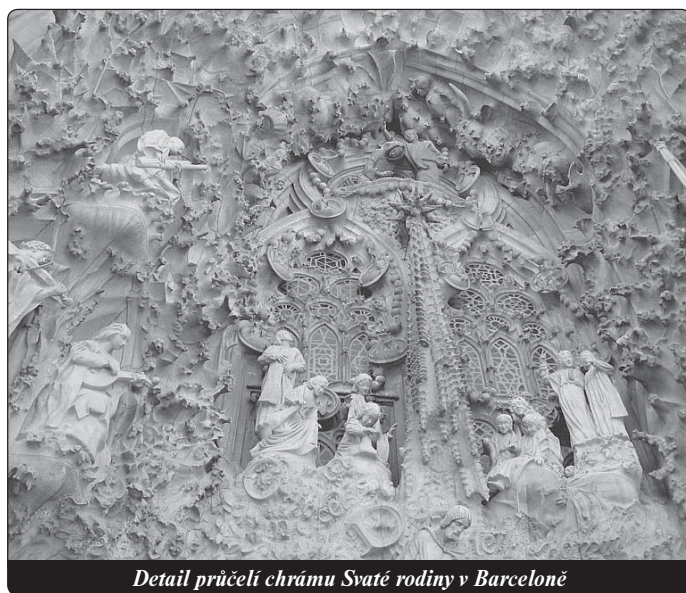
Detail průčelí chrámu Svaté rodiny v Barceloně

Zasvětili jsme tento sakrální prostor Bohu, který se v Kristu zjevil a vydal, aby Bůh definitivně přebýval mezi lidmi. Zjevené slovo, lidská přirozenost Krista, jeho církve jsou tři nejvyšší projevy jeho zjevení a jeho sebedarování lidem. Vždyt nikdo nemůže položit jiný základ nežli ten, který je už položen, a tím je Ježíš Kristus (1 Kor 3,11), říká svatý Pavel ve druhém čtení. Ježíš Kristus je kámen, který nese tíhu světa, který zajišťuje soudržnost církve a přivádí nakonec všechny výdobytky lidstva k jednotě. V Ném máme slovo přítomnosti Boží, od Něho získává církve svůj život, svou nauku a své poslání. Církve nemá trvání sama