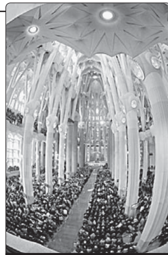
Chrám Svaté rodiny v Barceloně (snímek byl pořízen širokoúhlým objektivem „rybí oko“)

ze sebe; je povolána být Kristovým znamením a dílem v ryzí podřízenosti jeho autoritě a v plné službě jeho přikázání. Tentýž Kristus, který založil církve, je skálou, na které spočívá naše víra. Na tomto základě víry se snažíme společně ukázat světu tvář Boha, který je Lásky a který jediný může odpovědět na lidskou touhu po naplnění. To je velký úkol, ukázat všem, že Bůh je pokoj a nikoliv násilí, svoboda a nikoliv přinucení, jednota a nikoliv rozdělení. Věřím, že v tomto smyslu je posvěcení tohoto kostela Svaté rodiny v době, ve které se člověk pokouší budovat svůj život za Božími zády, jako by mu neměl vůbec nic co říct, velmi významnou událostí. Gaudí nám ukazuje svým dílem, že Bůh je pravou mírou člověka, že tajemství pravé originality, jak řekl, je v tom, vrátit se k původu, kterým je Bůh. Tím, že sám tak otevřel svého ducha Bohu, mohl v tomto městě vytvořit prostor krásy, víry a naděje, který vede člověka k setkání s tím, který je sám Pravda a Krása. Architekt tak vyjádřil svůj objev: „Jen chrám může reprezentovat důstojně smýšlení národa, neboť náboženství je v člověku to nejvznešenější.“