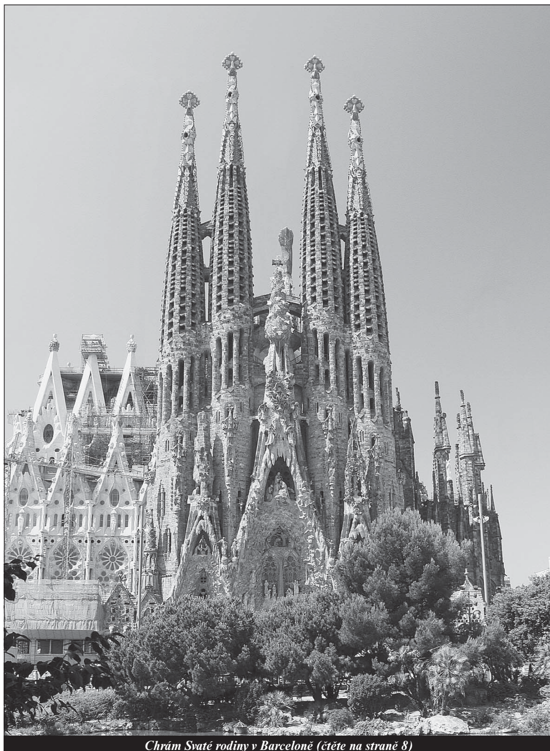
Chrám Svaté rodiny v Barceloně (čtete na straně 8)