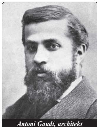
Antoni Gaudí, architekt

Zatímco se dívám na tomto svatém místě s úžasem na okouzující krásu, která tak silně vy-povídá o dějinách víry, prosím Boha, aby zde v Katalánsku povstávali a upevňovali se stále noví svědci svatosti, kteří nabízejí světu velké služby, jaké církev může a musí nabídnout světu: aby byli obrazy božské krásy, horoucími plameny lásky, cestou, která vede k tomu, aby svět uvěřil v toho, kterého Bůh poslal (srov. Jan 6,29).