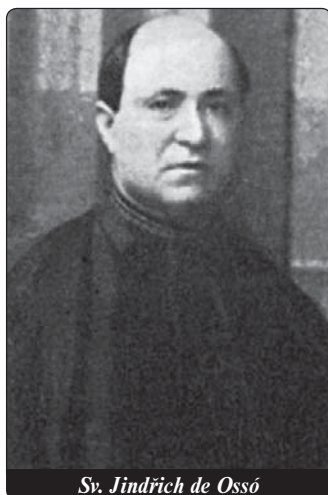
Sv. Jindřich de Ossó

V roce 1854 nebyla politická situace ve Španělsku nakloněna těm, kteří se chtěli zasvětit Ježíši Kristu. Semináře nemají struktu-