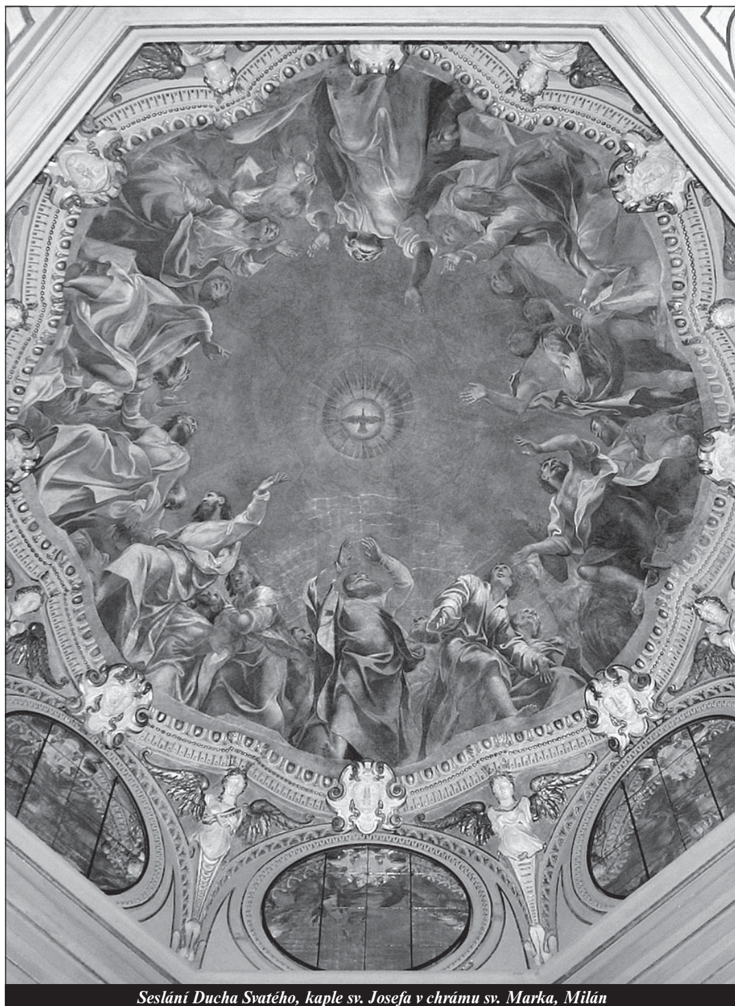
Sesláni Ducha Svatého, kaple sv. Josefa v chrámu sv. Marka, Milán

Muže z Plátna Osobní svědectví - strana 11 -