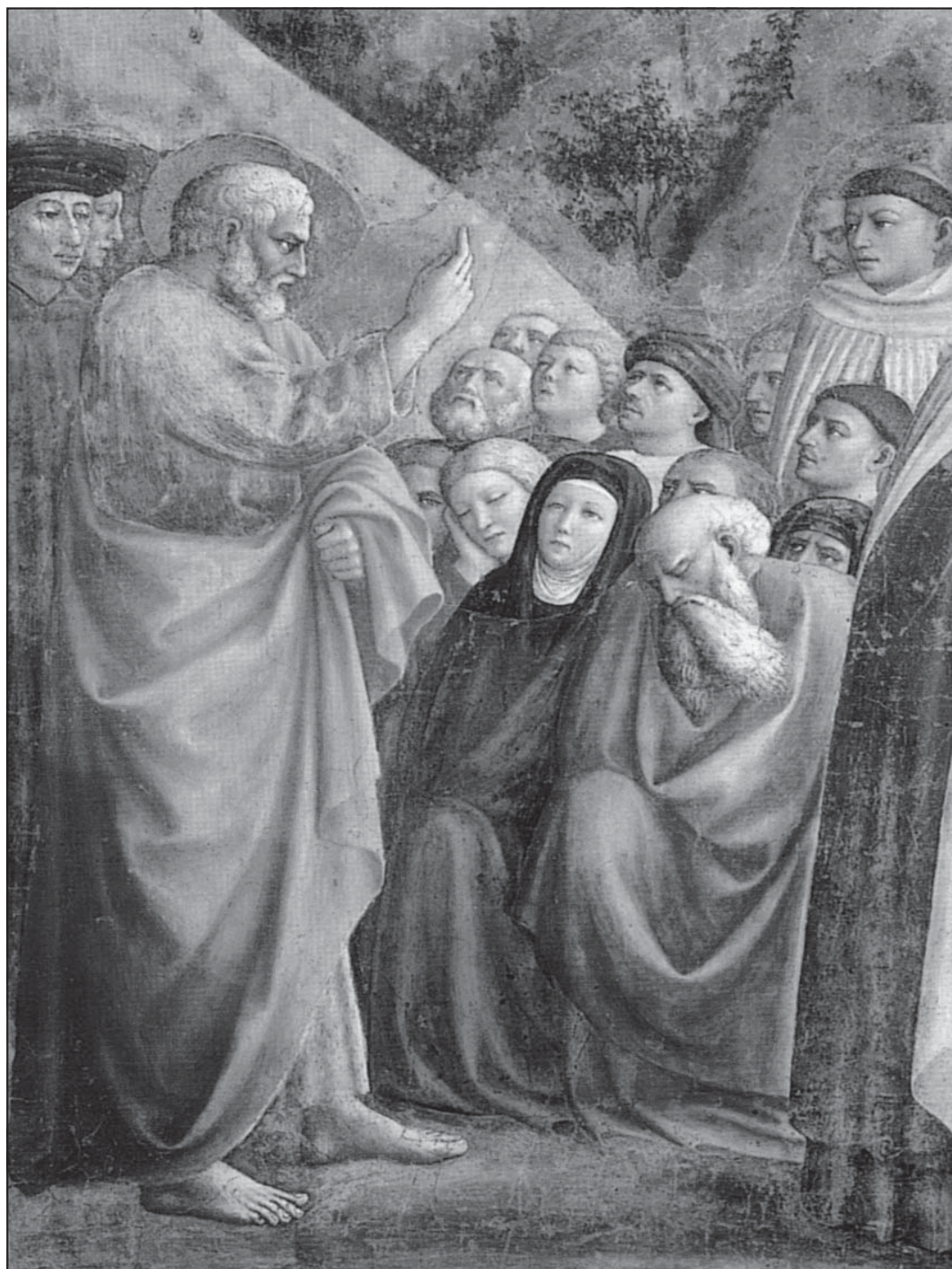
Tommaso Masolino (1383–1447): Kázání apoštola Petra, detail