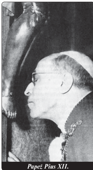
Papež Pius XII.

Jednou telefonovali po mši svaté ze Státního sekretariátu a žádali, aby Svatý otec zatelefonoval. Protože díkuvzdání trvalo obzvláště dlouho, zvonili podruhé. Domnívali se, že jsme zapomněli vyřídít vzkaz Svatému otci. S očima upřenými na kříž nad svatostánkem klečel Svatý otec nehnutě. „Svatý otče, žádají vás...“ Pomalu poklesly jeho složené ruce, ale jeho pohled setrval na kříži a Svatý otec řekl: „On je zde přibitý a nemůže se uvolnit, může vše jen snášet a trpět bez nářku a z lásky. Také papež je přibitý na jeho mís-