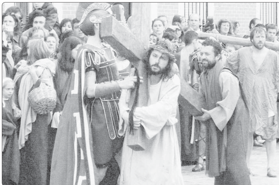
Křížová cesta při pašijových hrách ve španělském Oliva de la Frontera

To vše je ještě dnes úmysl popíračů Krista, těch, kteří nevěří, „jejichž chápání zasleplil bůh tohoto světa, aby neviděli