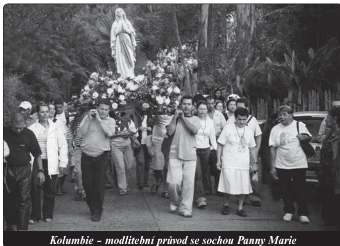
Kolumbie - modlitební průvod se sochou Panny Marie

že přijmou závazek každodenní modlitby, věrnost v zachovávaní Božích přikázání a poslušnost vůči učitelskému úřadu katolické církve. Od té doby každý rok v červnu obnovuje vláda spolu