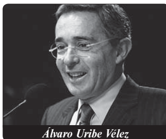
Álvaro Uribe Vélez