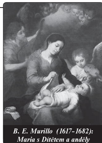
B. E. Murillo (1617–1682): Maria s Dítětem a anděly

Boží slovo, které oznamuje anděl, mohli bychom říct, ruší zá-