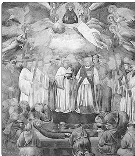
Giotto di Bondone (kolem 1267-1337): Smrt sv. Františka z Assisi

nekonečného stárnutí. Šířila by se drtívá pustina, ale také hluboké zoufalství lidstva, udušené v moři utrpení, a nemoci, které nikdy nekončí, protože žádná smrt nepřináší vysvobození. Lidé by se v bezvýhodnosti své existenční situace pokoušeli stále uhasit svůj vlastní život. Ale neúspěšně. Protože to by jim bylo navěky znemožněno. Ze zoufalství by