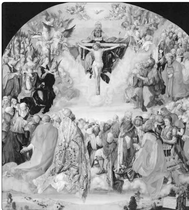
Albrecht Dürer (1471–1528): Klanění Nejsvětější Trojici ve společenství svatých

„Společenství svatých jsme my všichni, kteří jsme pokřtěni ve jménu Otce, Syna a Ducha Svatého, a kteří žijeme z darů Těla a Krve Kristovy, skrze které nás on chce proměnit a učinit sobě rovnými.“ (Benedikt XVI.)