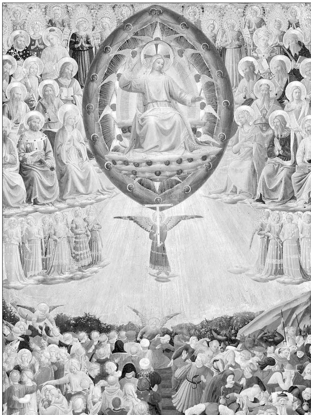
Blahoslavený Fra Angelico (kolem 1395–1455): Poslední soud, detail

klinickou smrt Svědectví Irminy, která po těžké dopravní nehodě prošla klinickou smrtí - strana 10 -