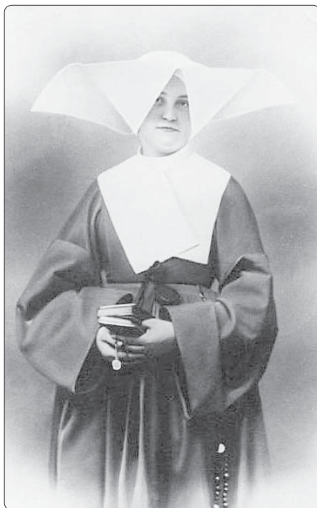
Blahoslavená Marta Wiecka

Rodičům napsala: „ Co se mne týče, nejsem s to vyjádřit, jak jsem šťastná. Tolik bych Vám to, rodiče moji milovaní, toužila alespoň několika slovy popsat, ale kdo může obsáhnout to štěstí, větší než cokoliv jiného na světě, že se může spojovat se Snoubencem? Snad postačí těchto pár mých slov: Můj Milý je můj a já jsem Jeho. Kéž bych se s Ním co nejdříve mohla spojit v nebi. “