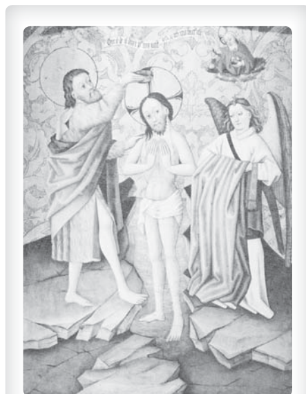
Křest Kristův, oltářní obraz (Muzeum umění, Dijon)

Ježíš nám odpouští naše všední hříchy, když máme pevný úmysl se jich už nedopouštět. On vyvažuje to dobro, které denně zanedbáváme, a napravuje naše opomíjení.