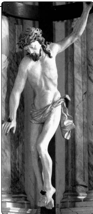
Kříž z kostela Svatého kříže v Bonnu

vlastní žádost přijme pomazání nemocných. Následují týdny nesnesitelných bolestí. Ale největší bolest jí působí pocit opuštěnosti: „ Neřká vůbec nic. To je nejtvrdší utrpení. On je pryč! “ A stále opakuje: „ Milovaný, přijď, ale přijď rychle. Matko, pomoz! “