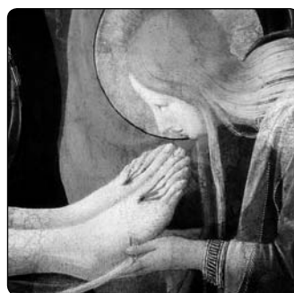
Fra Angelico: detail obrazu Plakávání Krista