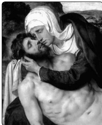
Willem Key: Pieta, Monako

ní poslání vidí jako zářivý paprsek, který vystupuje ze země k nebi. Pochopí, že jejím posláním je ohlašovat světu nejsvětější rány a obětovat je Bohu jménem celého lidstva. Od té doby se jí Ježíš